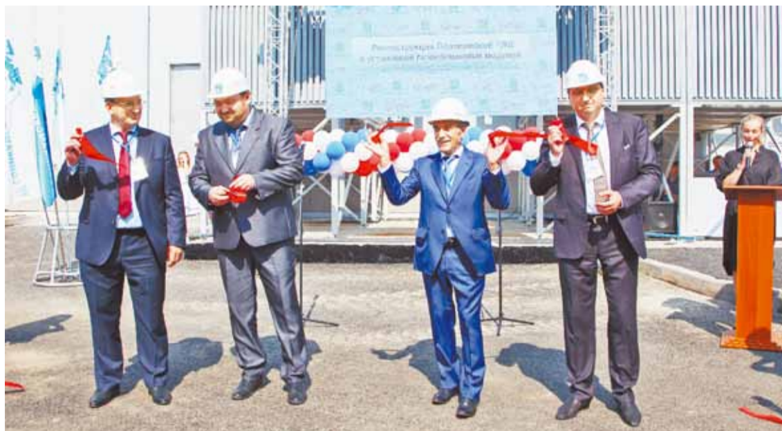
Церемония разрезания красной ленты

Юбилей в две пятёрки — пятидесятипятилетие — встретили цех очистные сооружения и отдел охраны труда и промышленной безопасности. Свой 70-летний юбилей торжественно отметили проектно-конструкторский отдел, дре-