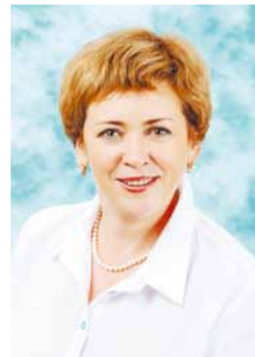
Фото С.В. Елисеевой на Доске почёта краевых профсоюзов