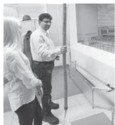
Господин Поддар решил проверить вес багра. Именно этим багром в 40-50-е годы женщины толкали древесину на транспортёр.

зована на достойном уровне. На побывавшего практически во всех основных цехах ОАО «Соликамскбумпром» господина Поддара, конечно, наибольшее впечатление производят бумагоделательные машины.