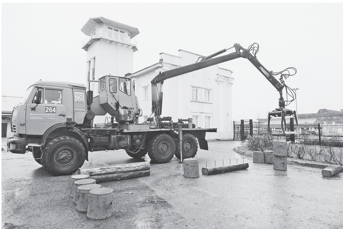
«Гвоздодёр», «Скамейка», «Пирамида», «Коробок» — самые зрелищные задания конкурса.

Успешно справившись накануне с теоретическим этапом (тестовые задания, до поры хранившиеся в строгом секрете