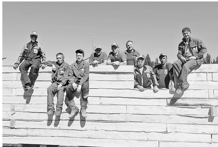
Комплексная бригада РСЦ и ОСП Вишера на строительстве общежития в Вае

Строительство в посёлке идёт полным ходом с 12 мая: залили 113 буроналивных свай под общежитие, и в данный момент каркас здания уже практически готов. Весь пиломатериал обрабатывается огнебиозащитным составом.