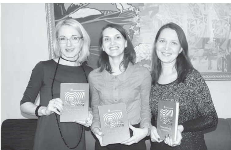
Старшие воспитатели НДОУ «ЦРП «Соликамскбумпром» в восторге!