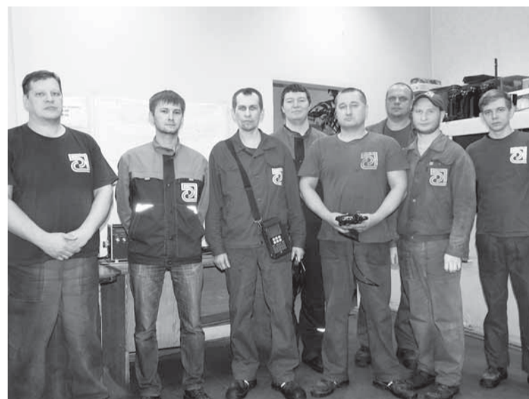
Славный коллектив ЛТДО.

— На бумкомбинате я работаю с 2011 года, пришёл на производство по окончании Пермского политехнического института. С 2013 года по производственной необходимости исполнял обязанности начальника лаборатории, а в этом году назначен на должность начальника ЛТДО. Считаю, что лаборатория за прошедшие 40 лет накопила большой опыт работы. В коллективе существует преемственность, опытные работники помогают молодёжи на нелёгком пути профессионального становления. В планах у нашего коллектива дальнейшее профессиональное развитие. Диагностика — это такая сфера деятельности, где требуется постоянное самообразование, освоение новых методов исследования и новых современных измерительных приборов.