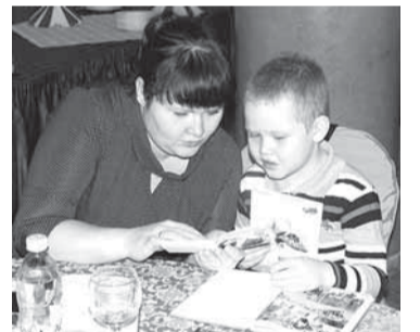
Раздел «Остров детства» понравится юным читателям.