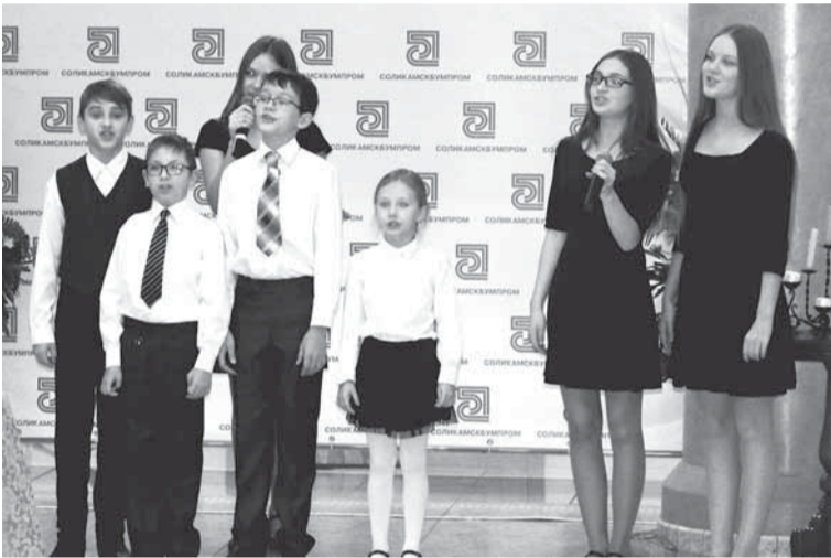
Театр-студия «Перемена» славит в своей песне труд бумажников.