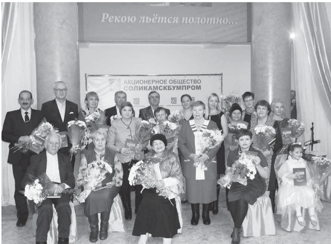
Этот день стал для авторов сборника настоящим праздником.

ПОЖАЛУЙ, ГЛАВНОЕ ЛИТЕРАТУРНОЕ СОБЫТИЕ АО «СОЛИКАМСКБУМПРОМ» СОСТОЯЛОСЬ В МИНУВШУЮ ПЯТНИЦУ — УВИДЕЛ СВЕТ СБОРНИК СТИХОВ И РАССКАЗОВ РАБОТНИКОВ И ВЕТЕРАНОВ НАШЕГО ПРЕДПРИЯТИЯ «РЕКОЮ ЛЬЁТСЯ ПОЛОТНО». ПРЕЗЕНТАЦИЯ СБОРНИКА СТАЛА ДОЛГОЖДАНЫМ И ВОЛНУЮЩИМ СОБЫТИЕМ И ДЛЯ АВТОРОВ, И ДЛЯ ВСЕХ ТЕХ, КТО РАБОТАЛ НАД ВЫПУСКОМ.