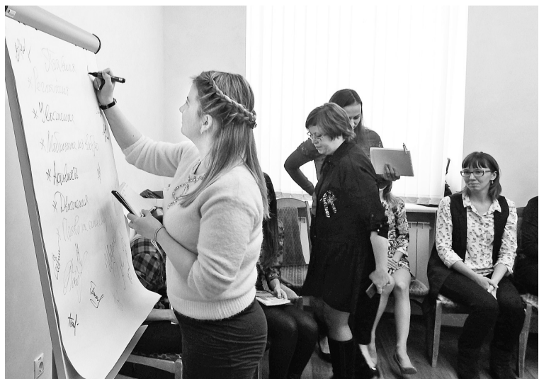
Важно мнение каждого