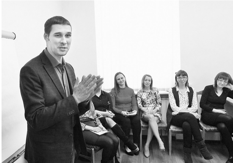
Тренер из Нижнего Новгорода знакомится с группой

В проекте «В центре края» приняли участие более десяти тысяч представителей молодёжи из 15 муниципалитетов Пермского края. Среди участников 100 молодых работников нашего предприятия в возрасте до 35 лет. Встречи были организованы на четырёх площадках. Руководство АО «Соликамскбумпром» предоставило возможность молодым бумажникам определить с помощью тренеров зону своего личного и социального ближайшего развития, получить инструменты планирования и управления собственной эффективностью, обсудить актуальность гражданской позиции. Конечная же цель проекта — активизация молодёжи, направленная на развитие гражданского общества, выработка новых идей развития городов и территорий Прикамья.