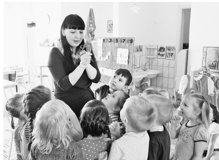
Перед каждым занятием появляется волшебный зонтик: «Зонтик открывается, чтение начинается»