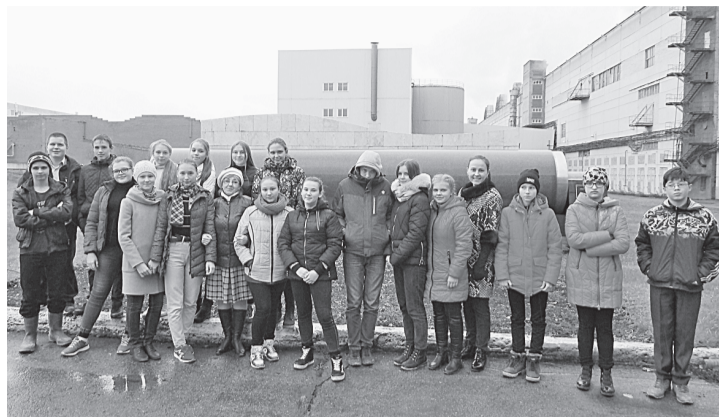
Школьники затонской и тюлькинкой школ

Отдел кадров АО «Соликамскбумпром» принял участие во всероссийской акции «Неделя без турникетов», которая проходила с 15 по 21 октября 2018 года.