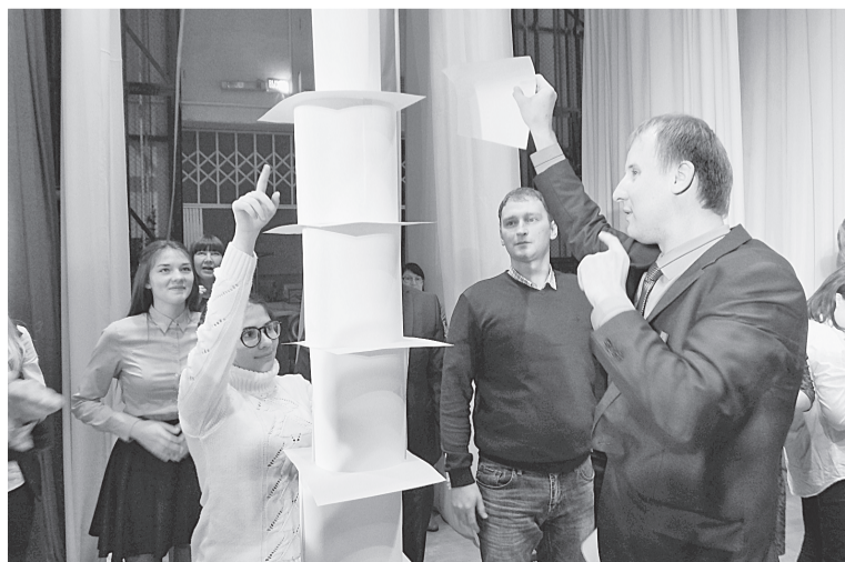
Самую высокую башню построили... без слов!