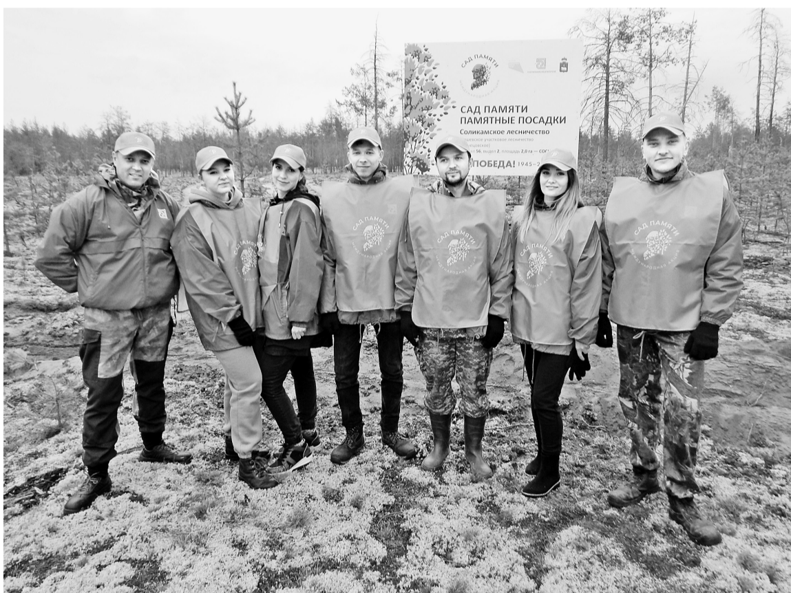
Волонтеры АО «Соликамскбумпром»

Одно из мероприятий акции этого года прошло 14 мая на территории Соликамского лесничества.