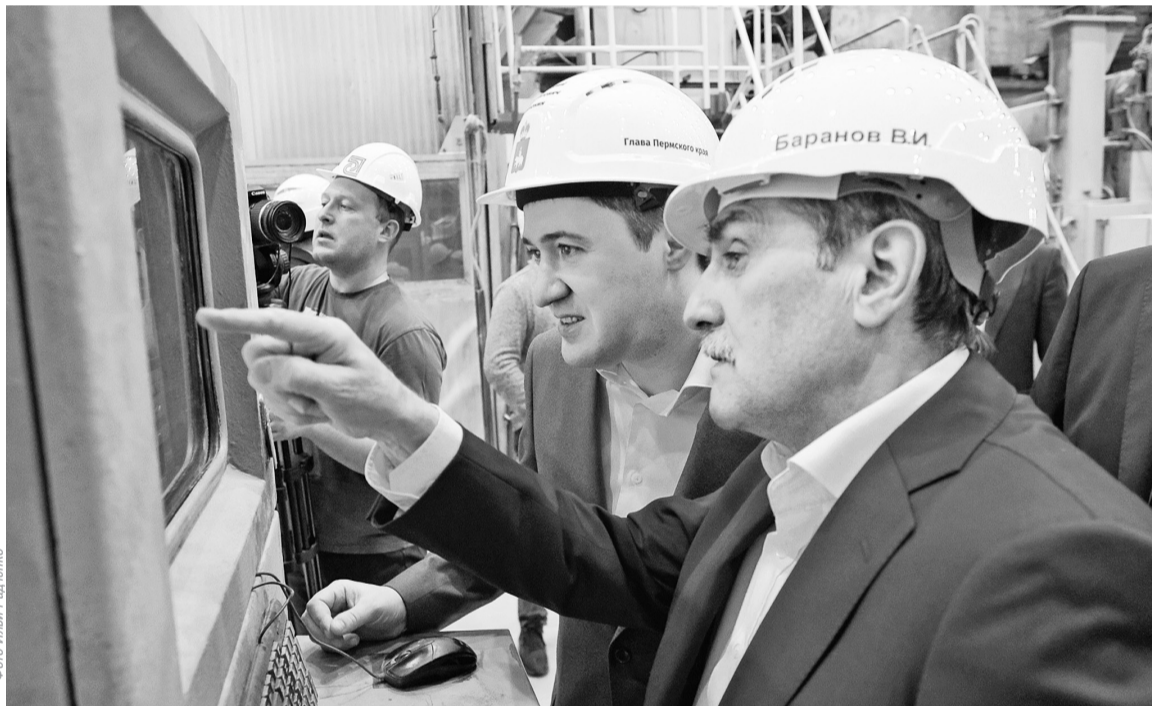
Глава региона Д.Н. Махонин и президент АО Соликамскбумпром В.И. Баранов у рабочего места сушильщика БДМ № 2

В рамках действующей поэтапной Программы развития предприятия в 2019 году был реализован проект реконструкции Соликамской ТЭЦ. Именно с осмотра новых газопоршневых модулей началось знакомство Дмитрия Николаевича с нашим предприятием. Глава региона обратил внимание на тот факт, что в результате реализации проекта не только увеличилась энергоёмкость ТЭЦ, но и повысилась надёжность тепло-