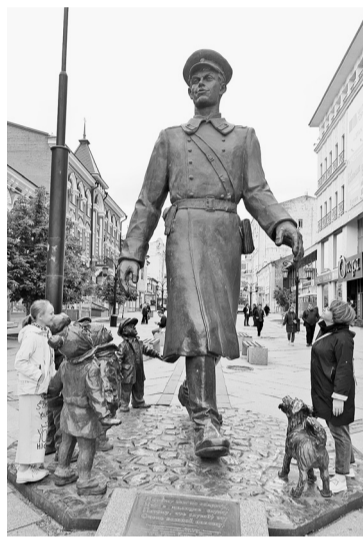
Вот ты какой, Дядя Стёпа! Самара

с любой точки города. Прочувствуете атмосферу и соприкоснётесь с историей великого подвига тысяч людей. Это важно знать и взрослым, и детям. Пробирает до мурашек. Приезжаю сюда в третий раз, и каждый раз открываю для себя что-то новое.