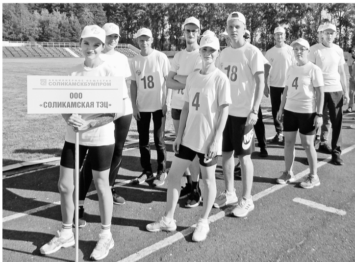
Команда ООО «Соликамская ТЭЦ» на параде участников «Спортивного БУМа»