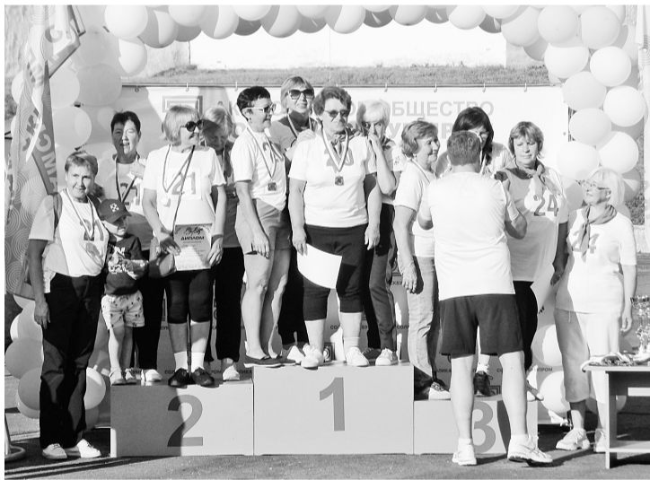
На пьедестале — ветераны

«Море волнуется...». Все участники соревнований «Спортивная семья» настолько в прекрасном настроении, что, кажется, уже и не думают о том, какое место займёт их команда. И всё же на пьедестал, к сожалению, поднимутся не все.