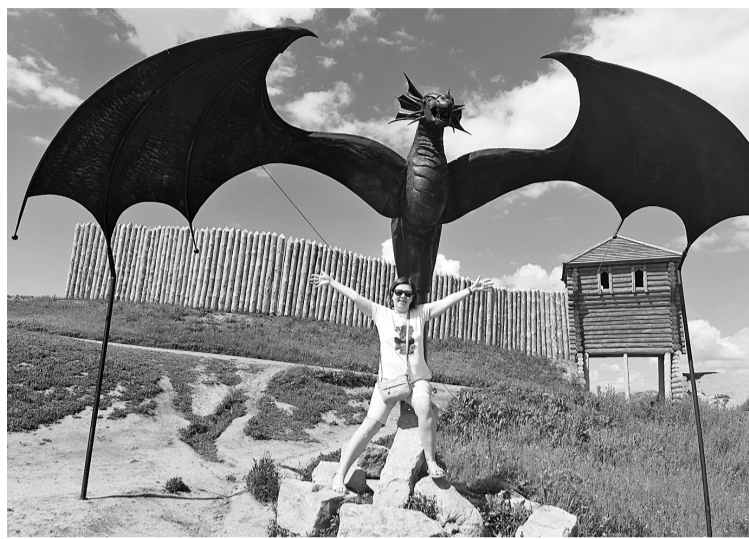
«Мать драконов». Чёртовое городище. Елабуга

Главная цель нашей поездки — город-герой Волгоград. Обязательно берите экскурсию с посещением Мамаева кургана. Скульптуру «Родина-мать зовёт» видно практически