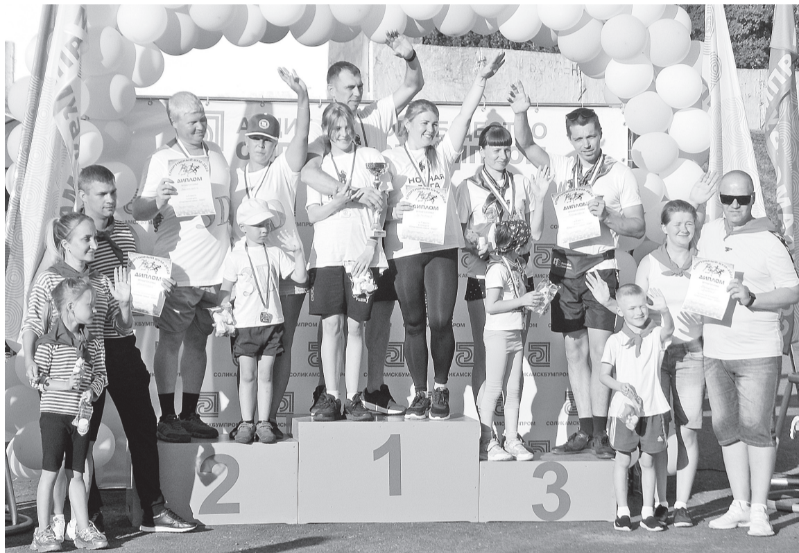
Спортивная семья. Участники и победители

По тёплому лету, солнцу, по свободе движения и передвижения, по замечательному ощущению «мы вместе!» Бумажники, а также их родные, друзья и знакомые с радостью пришли на одно из своих любимых корпоративных мероприятий АО «Соликамскбумпром» — «Спортивный БУМ».