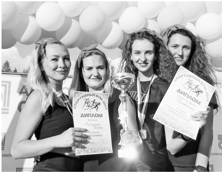
Команда-победитель в женской эстафете