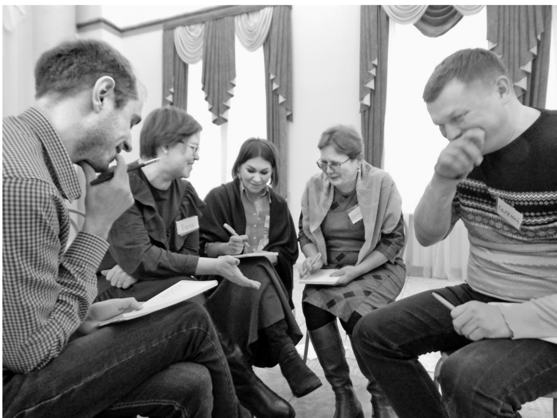
Одна из групп обсуждает во время тренинга задачу-провокацию

У кого-то получается, а у кого-то возникают сложности. Все