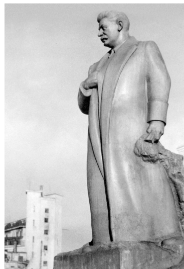
Памятник Сталину, который стоял на площади перед предприятием

Подготовила Ольга Пегушина по воспоминаниям Геннадия Корзникова, а также материалам сайта http://solbibfil2