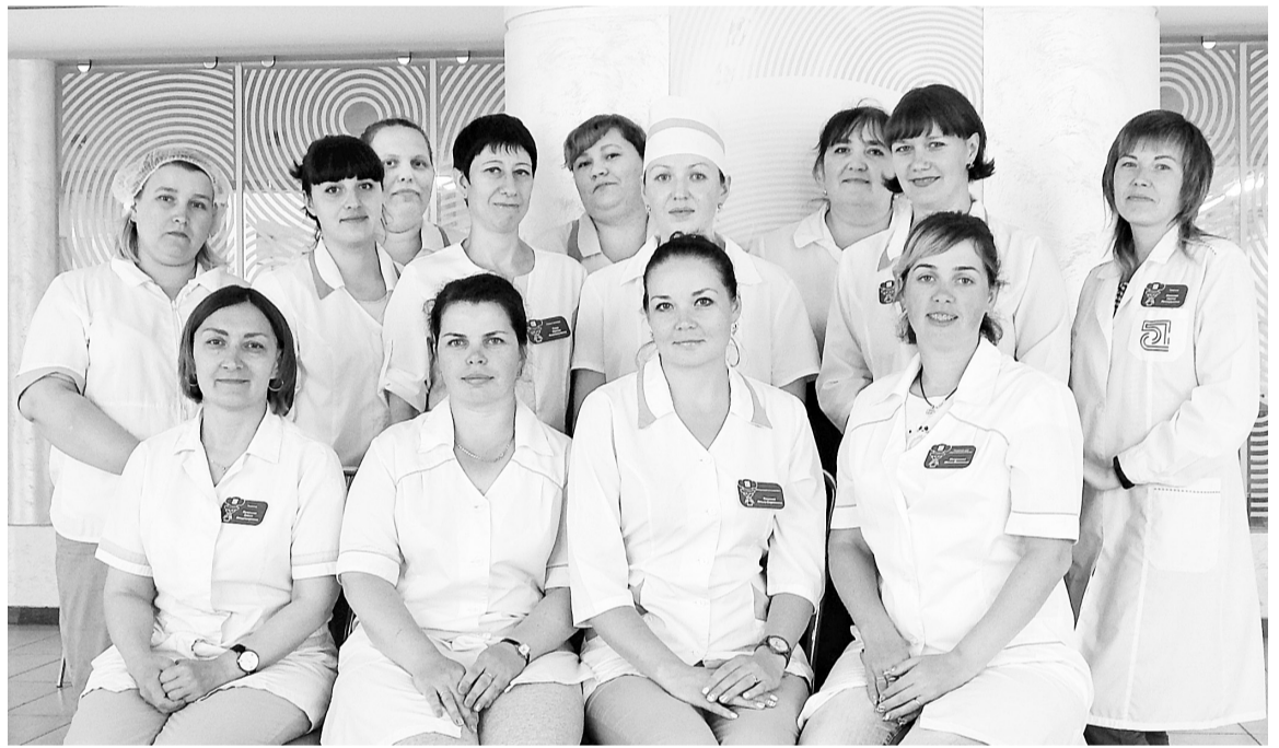
Коллектив цеха общественного питания

Цех общественного питания успешно выступил на конкурсе «Прикамская кухня». Планируем активнее участвовать в подобных конкурсах. Наши работники стре-