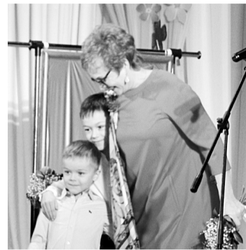
Внуки поддерживают бабушку-участницу конкурса «Красотки элегантного возраста»

Если пожилой человек радуется достижениям детей (будь то в профессиональной деятельности, будь то в семейной жизни), если они уважительны по отношению к окружающим, трудолюбивы, то именно