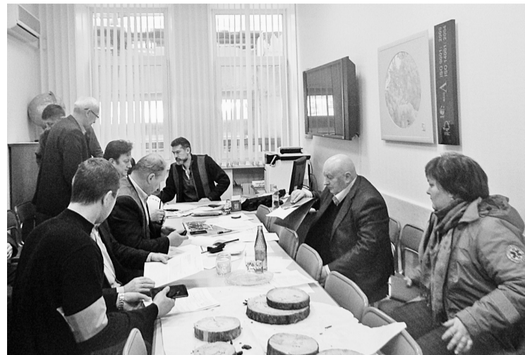
Заседание комиссии по чрезвычайным ситуациям

щите персонала от возможных опасностей. В ходе заседания обсудили также возможные варианты развития событий, внесли предложения по организации новых учений.