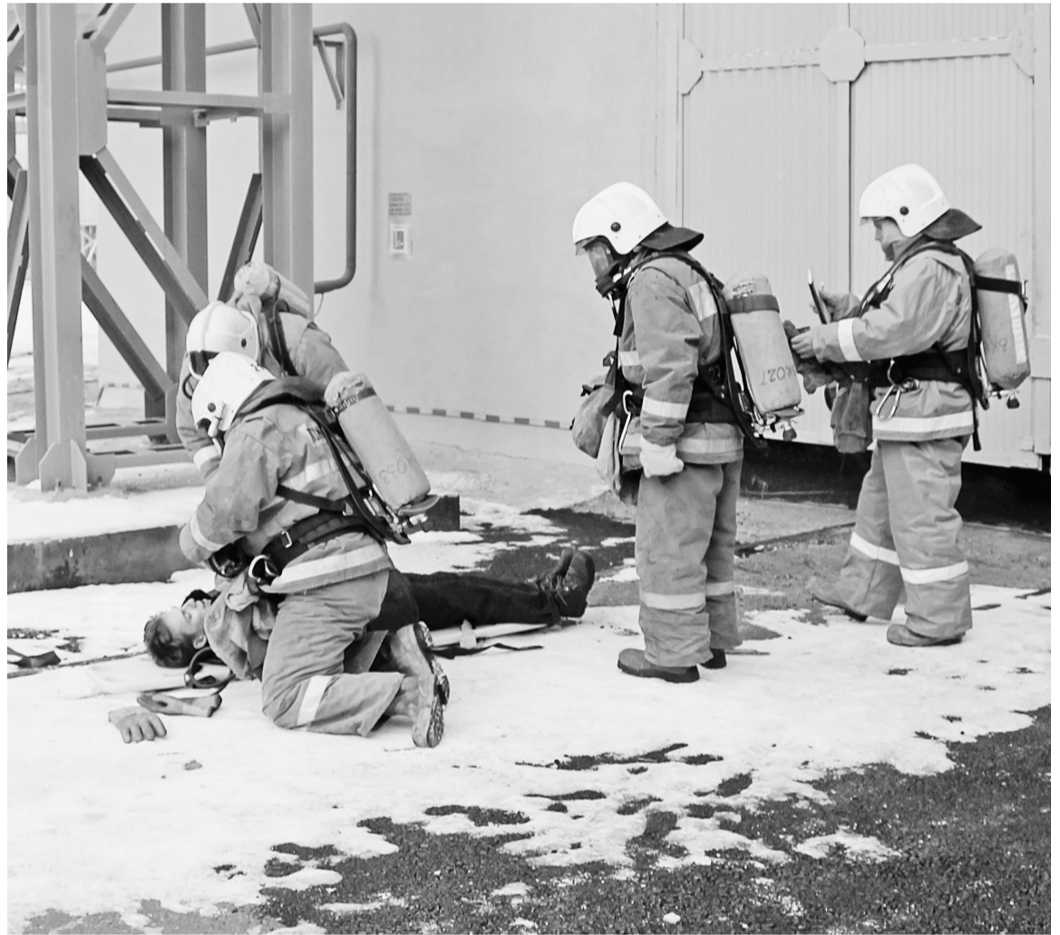
Оказание условно пострадавшему первой помощи

В ходе учения отрабатывались действия в условиях аварии на потенциально опасных объектах (опасных производственных объектах). Для нашего предприятия это было возможностью совершенствовать