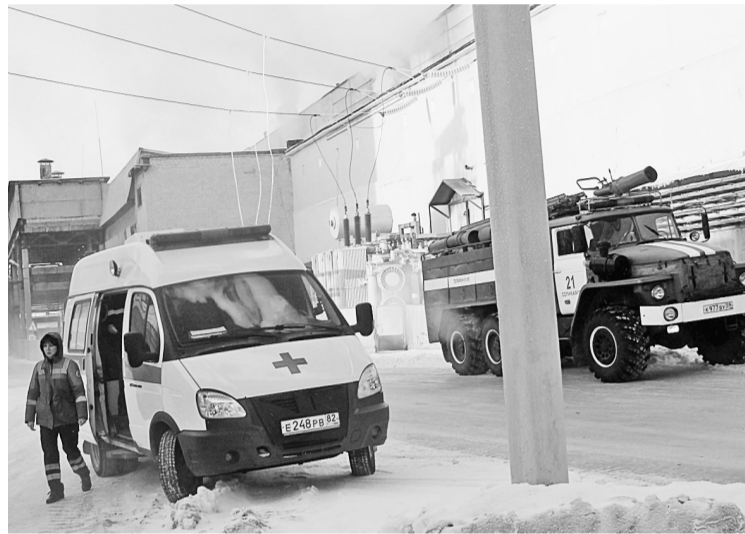
Городские службы спасения в полной готовности