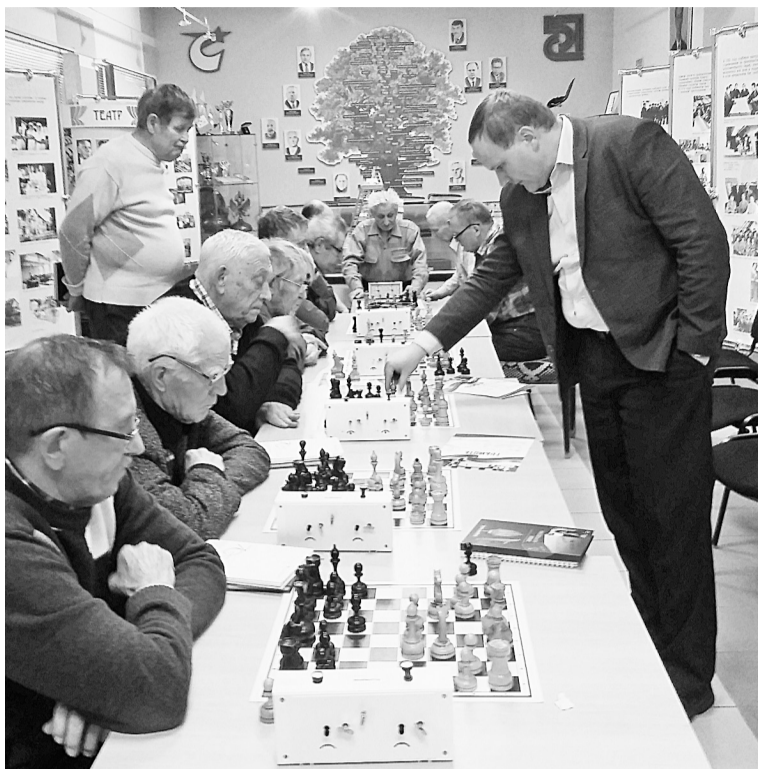
Сеанс одновременной игры

После оглашения итогов турнира прошло награждение. За места с 1 по 5 были вручены денежные призы и грамоты учредителем при-