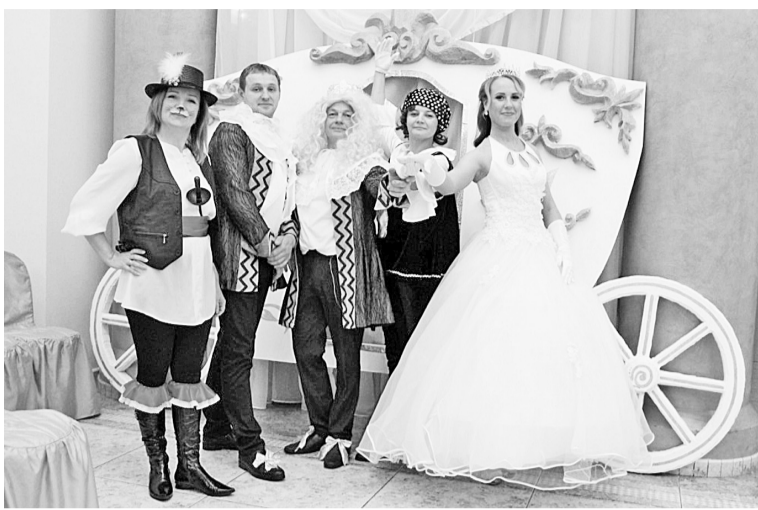
Все на бал!

Это был удивительный по своей красоте и эмоциям бал! Праздник открылся под звуки полонеза. Как только услышишь эту величественную музыку, невольно выпрямляется спина, тянется носочек, вспо-