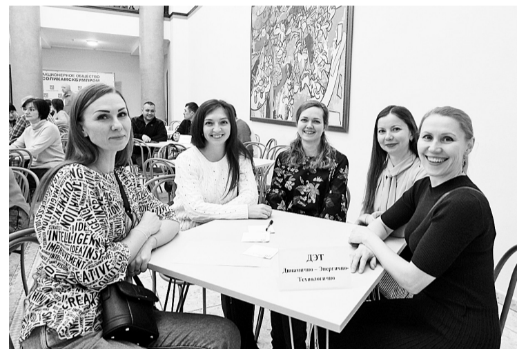
Динамично-энергично-технологичные специалисты ОГТ