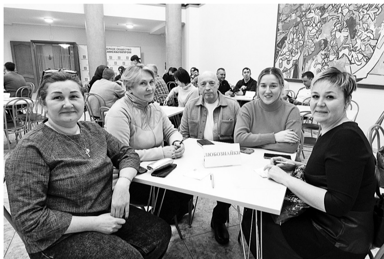
«Любознайки» из ЦОГП