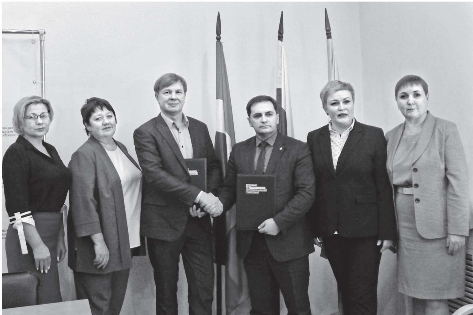
На подписании 4-х стороннего соглашения в Администрации Соликамского городского округа

2 февраля 2024 года состоялось подписание четырёхстороннего соглашения о сотрудничестве и взаимодействии между Краевым Государственным Автономным Учреждением «Центр опережающей профессиональной подготовки Пермского края», администрацией Соликамского городского округа, управлением образования и представителями градообразующих предприятий города.