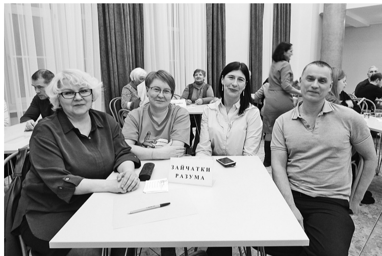
Сборная РМЦ и ЦЦР «Зайчатки разума»