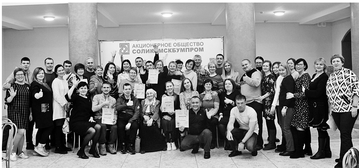
«Бумовские знатоки - 2024»

■ Ветераны предприятия выставили для участия команду