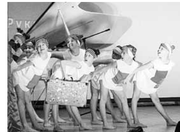
«Чемоданное настроение». Студия танца «Каприз»