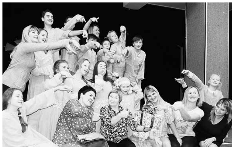
У кого тут юбилей?

Когда я начала работать с детьми, они вышли для меня на первый план. Почему? Например, в группе 15 человек, а в пьесе ролей вполтину меньше. И я начинаю выдумывать роли. Тех, кто помладше, ввожу в спектакли старшей группы. Ведь ребят