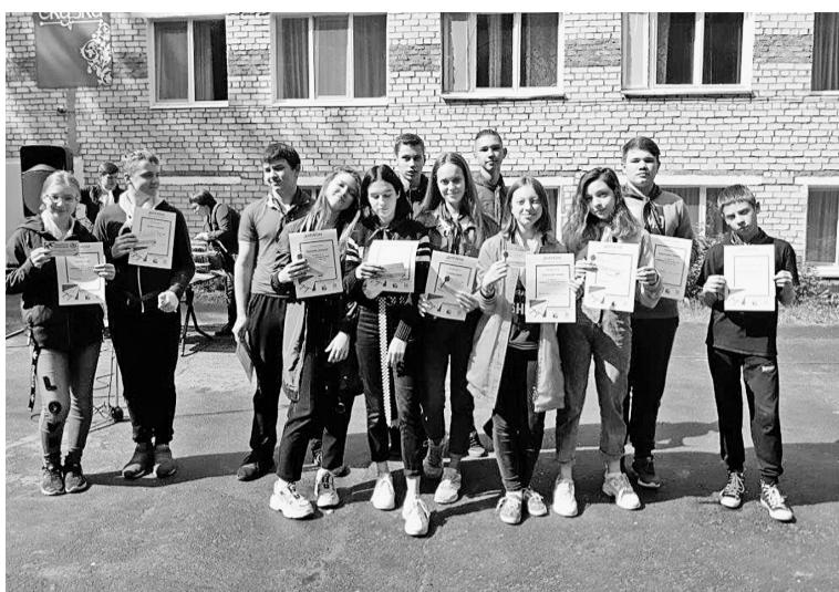
Выпускники Школы бумажника

В этом году смена проходила в период с 17 июля по 6 августа. Сто восемьдесят детей не только играли, веселились, заводили новых друзей, но и участвовали во всевозможных мероприятиях. Так, юные бумажники посетили с обзорной экскурсией промплощадку АО «Соликамскбумпром» и музей истории предприятия. Чуть позже они строили макеты технологического оборудования, проявляли свои таланты в области моды, используя для создания нарядов газетную бумагу. Молодёжное объединение «Бумеранг» провело игру на командообразование «Стратегия 2:0». Словом,