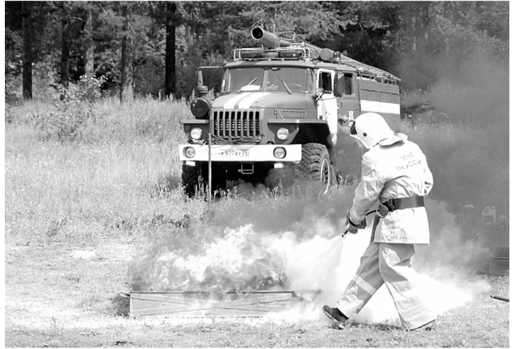
Самый «горячий этап!»