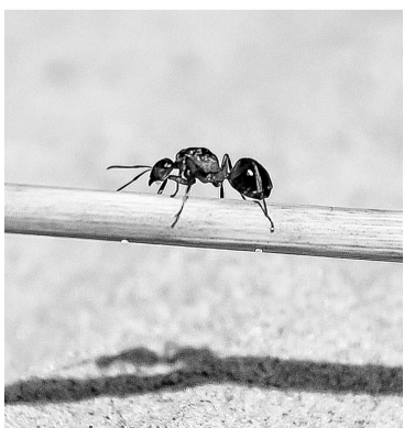
С.Е. Дукки, «Муравей»

1 место — ЦМТОП; 2 место — БП №2 (2-я команда); 3 место — ОЛТК (1-я команда).