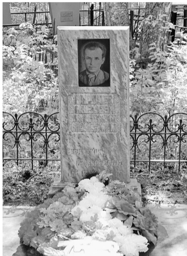
Могила А.И. Горячева

В восьмидесятые годы комсомольцы привели в порядок оградки могил. Женщины-ветераны бумкомбината поддерживали могилы в порядке.