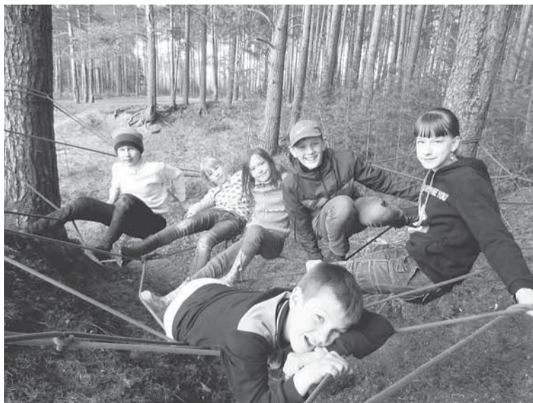
Для детей на Редикоре была подготовлена специальная программа. Им точно было нескучно!