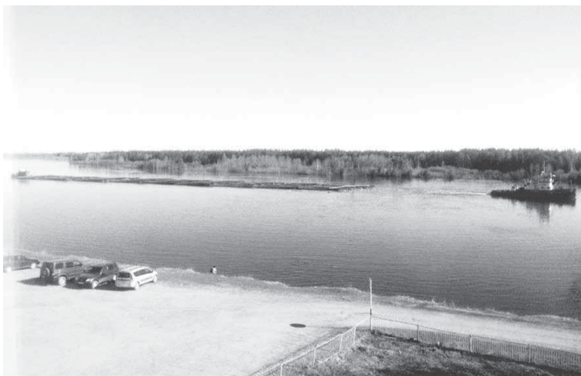
Буксировка плота от плотбища у посёлка Гайны.

ДАВНО НЕ БЫЛО ТАКОГО СРЕМИТЕЛЬНОГО ПРИХОДА ВЕСНЫ, КАК В ЭТОМ ГОДУ. НЕ УСПЕЛИ ОГЛЯНУТЬСЯ, КАК ЛЕДОХОД ПРОШЁЛ, А В ЗАТОНЕ — ПЛОТЫ. КАКИМ ЖЕ БЫЛ СПЛАВ-2016?