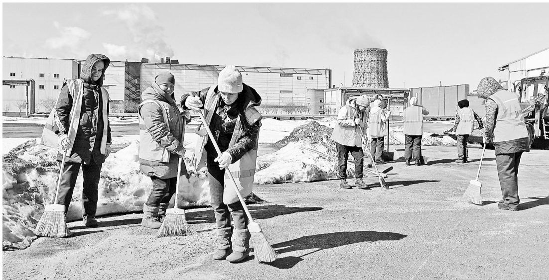
Вот так вместе, вот так дружно!

В сравнении с прошлым годом объём песка, который был использован для подсыпки, был намного больше. А с наступлением весны работники участка приступили к уборке этого песка. Уборка песка ведётся вручную, коммунально-дорожными машинами со щётками и погрузчиком. Начали мы очистку от песка с направлений, где проходят основные потоки людей, но продвигаемся по всей территории, очищая участок за участком.