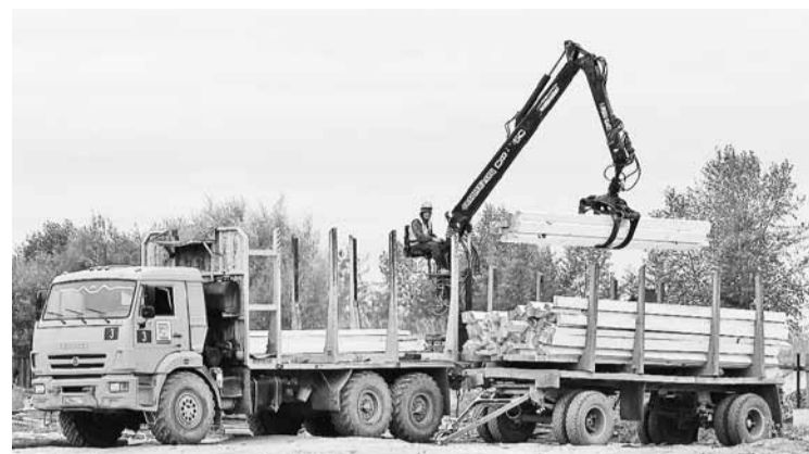
При помощи самогруза производится отгрузка пиломатериала в с. Полоустное для устройства вахтового посёлка