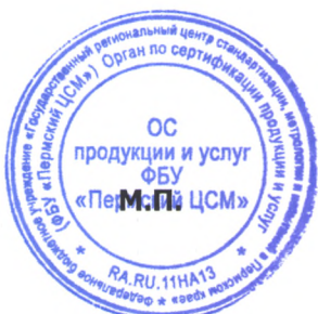
Схема сертификации 1с