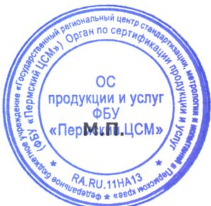
Схема сертификации 1с