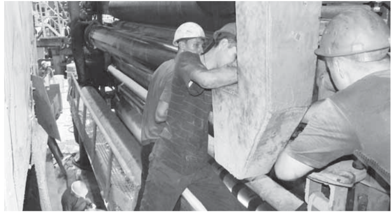
Производится замена каландровой батареи.