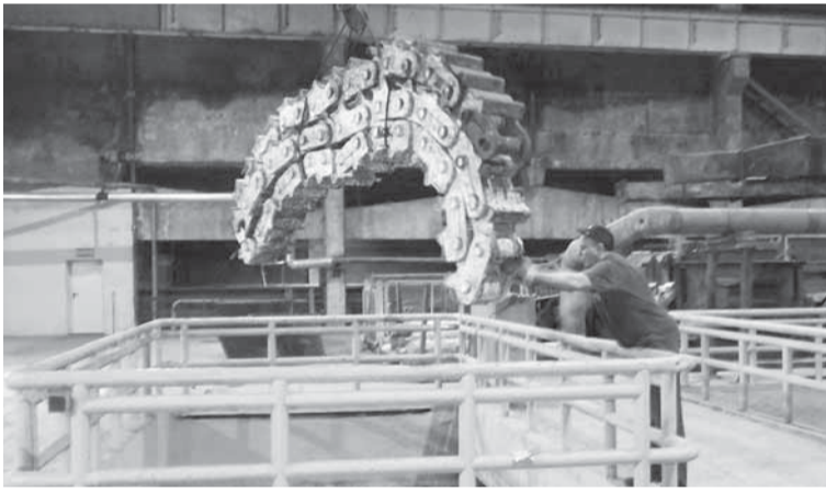
В процессе сборки рабочих цепей дефибрёра А.Д. Юдичев.

цехом объектов отличаются особой сложностью? — Лёгких объектов нет. Но в особенно интенсивном режиме работает наш участок ППР древесно-массного производства. Практически каждый день проводятся планово-предупредительные ремонты. Продолжается ремонт дефибрёрного парка. Нагрузка на бригаду высокая, к тому же количество единиц обслуживаемого оборудования возросло — добавилась линия импрегнирования. В бригаде до недавнего времени работало 15 человек, но в связи с производственной необходимостью бригада доукомплектована до 19 человек. Бригадой руководят 2 мастера. Обслуживанием и ремонтом дефибрёрного парка руководит Андрей Николаевич Рогожин . За обслуживание и ремонт оборудования линий по производству ТММ отвечает Иван Сергеевич Литвиненко . Оборудование линий ТММ — высокотехнологичное, для работы с ним требуются хорошие профессиональные знания, опыт. Так как у Андрея Николаевича опыта больше, то он помогает в организации ремонта, работы бригады. Оборудование участка по