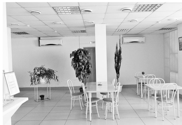
Уютный, светлый и тихий зал буфета