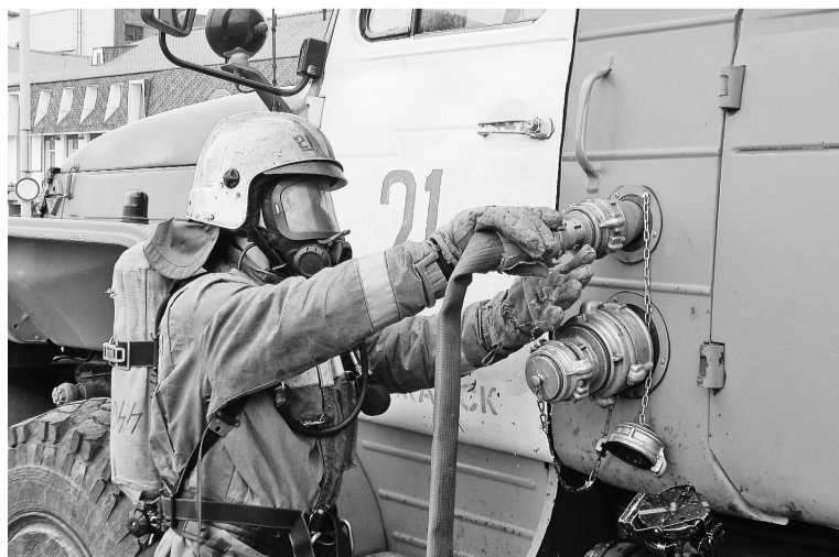
Зачёты и нормативы пожарные сдают согласно графику