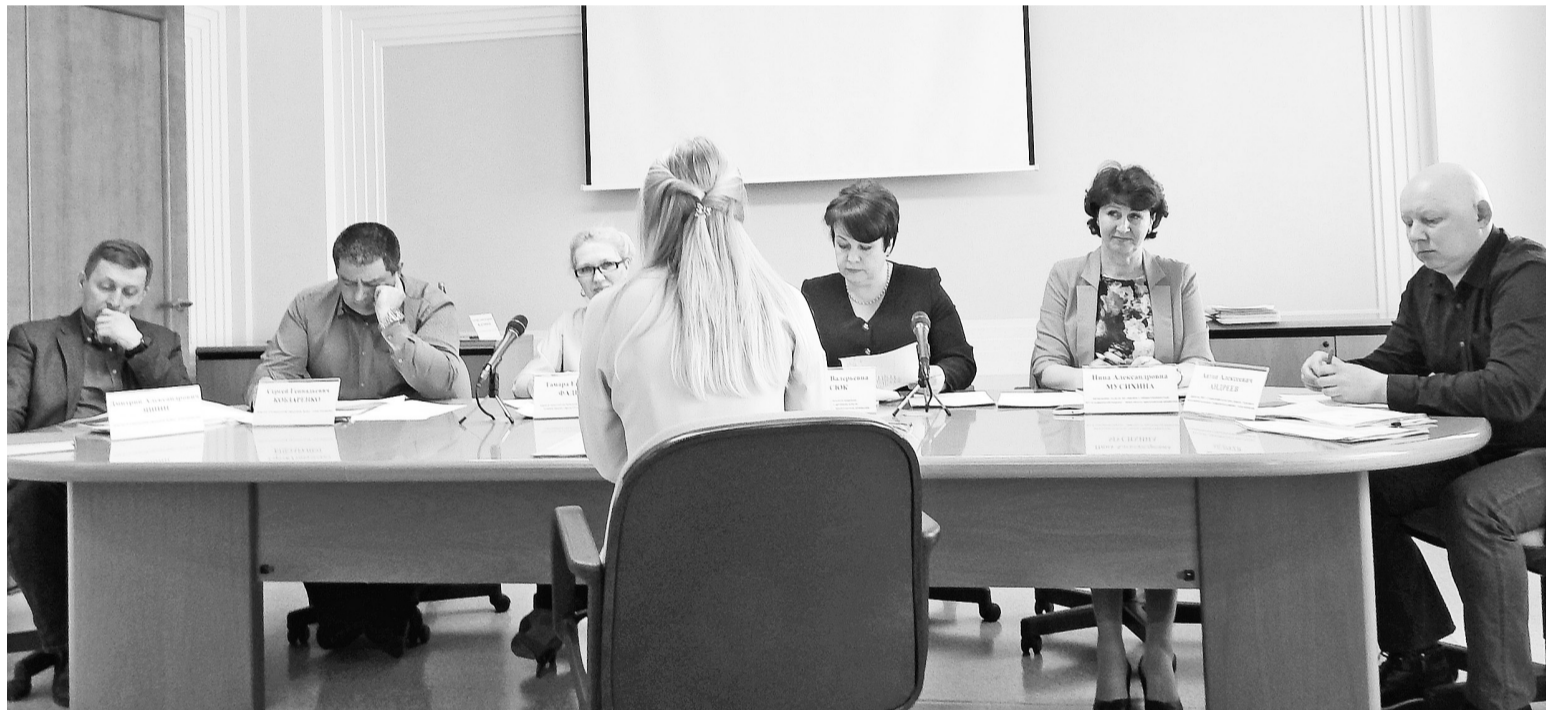
Конкурсная комиссия разбиралась в сути каждого проекта. Члены комиссии часто задавали уточняющие вопросы

Зал заседаний в управлении АО «Соликамскбумпром» собрал 10 апреля людей, заинтересованных в решении важных для соликамцев проблем, в реализации идей, которые помогут жителям города и района стать лучше, добрее и, может быть, счастливее.