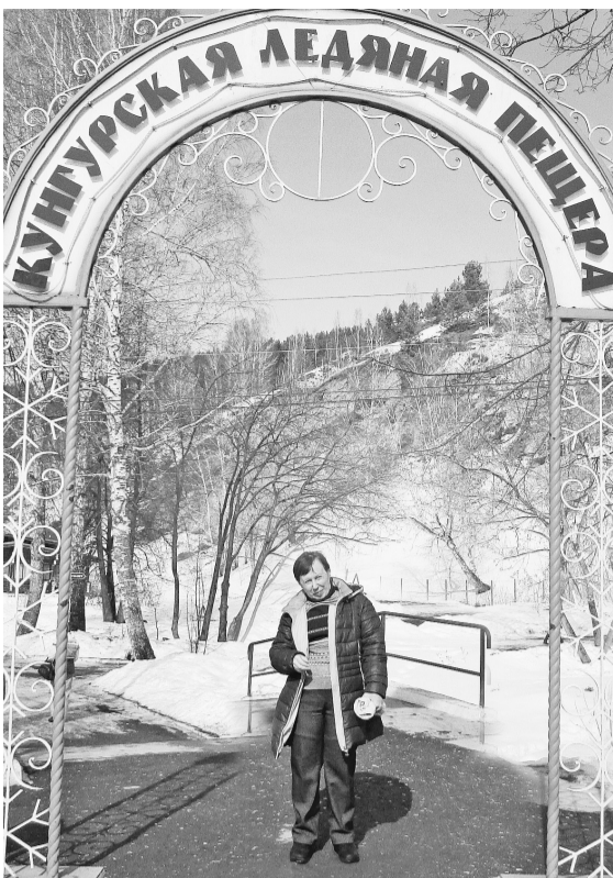
Автор репортажа в стихах О.Б. Шишкина

Не тронь рукою сталагмиты, Ладонью наледь не тревожь. Ты этим навредишь пещере. С собой же чудо не возмёшь.