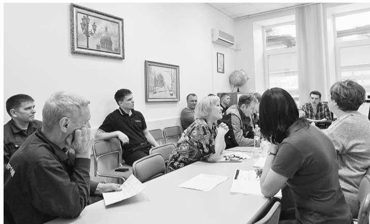
Паритетная комиссия обсудила каждый пункт проекта соглашения по охране труда на 2018 год

В пятницу 6 апреля в кабинете главного инженера прошло заседание паритетной комиссии по охране труда. В комиссию входят представители работодателя в лице главных специалистов и представители работников, избранные трудовым коллективом на конференции по Коллективному договору.