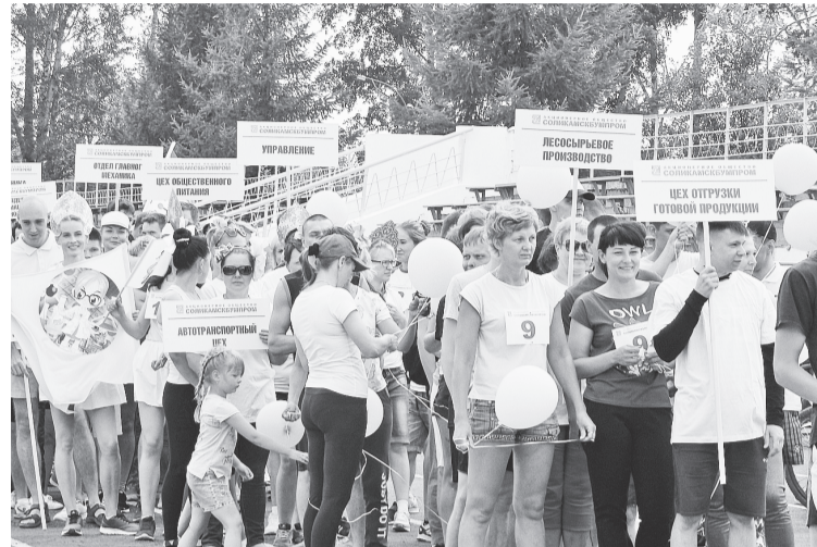
К параду готовы

I место — БП №2; II место — РМЦ; III место — ДМП.