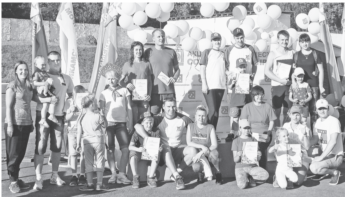
Спортивные семьи АО «Соликамскбумпром»

Задолго до начала открытия «Спортивного Бума — 2018» трибуны и сам стадион были украшены воздушными шарами, флагами и баннерами с символикой предприятия, звучала заряжающая бодростью и спортивным азартом музыка. Участники соревнований и зрители примерялись к фотозоне с пьедесталом в центре. Все могли почувствовать себя победителями и чемпионами. У палатки цеха общественного питания собрались те, у кого разыгрался аппетит. А дети с нетерпением ожидали начала «Спортивной ярмарки». Взрослые изучали стенды, где были прописаны план построения, последовательность проведения соревнований, порядок забегов эстафеты и другая информация.