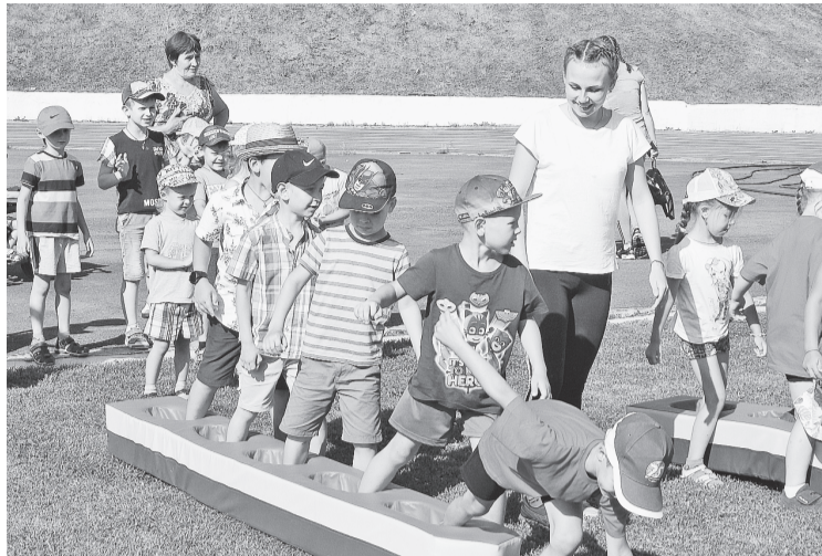
Вот такие нам выдали лыжи

Праздник набрал обороты и над стадионом прозвучало: