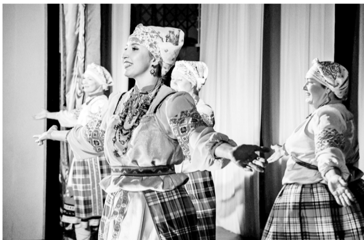
Вокальный коллектив «Апрель» участвует в «Ярмарке талантов»