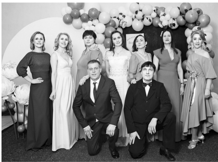
Участники «Весеннего бала» в фотозоне ДК «Бумажник»

пародий и двойников с участием ростовых кукол.