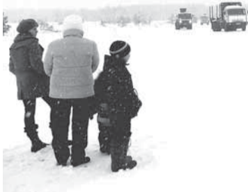
Сейчас проедет папина машина.

— И техники, которая будет задействована в вывозке леса, стало больше, и коллектив цеха стал больше.