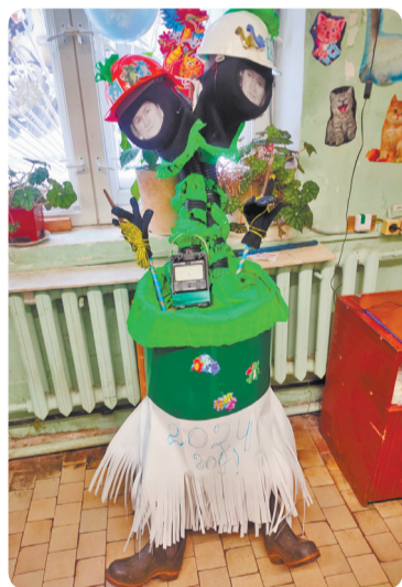
Знаменитая Дракоша энергоцеха