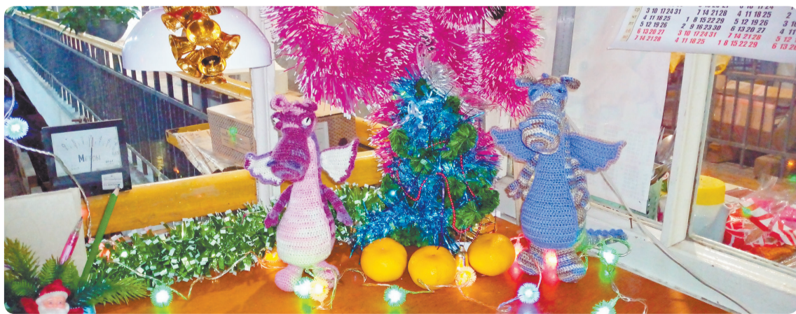
Драконы в ЦВС