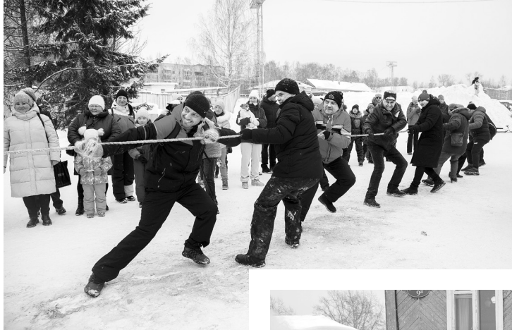
Эй, ухнем! Ещё разик, ещё раз!

Следующее испытание — городки. Со стороны кажется, что сбить фигуру легко. На самом деле, чтобы получить нужное количество жетонов, нам пришлось подключать «тяжёлую артиллерию» — мужчин.