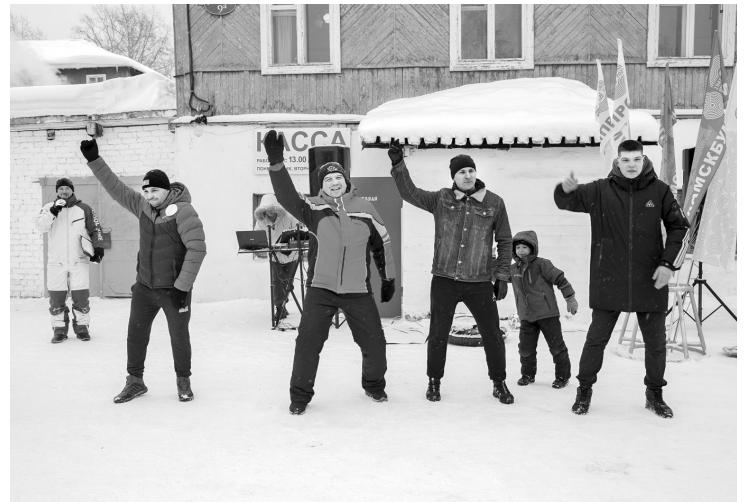
Танцы — дело настоящих мужчин

Фотографии доступны для скачивания до 17 марта 2023 года: https://cloud.mail.ru/public/9vVn/NcGyZ4q8u