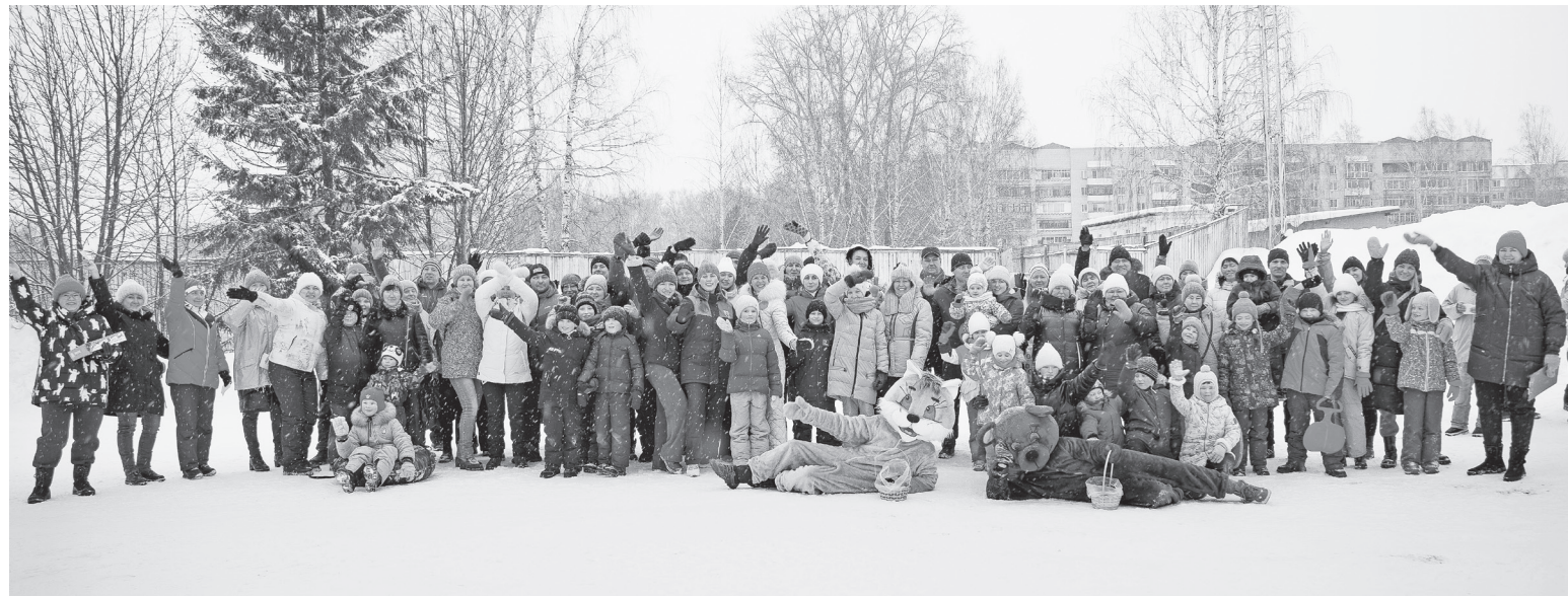
«Зима в движении» - 2023: С нами только лучшие!

Так и случилось, как в песне поётся. Прямо на глазах субботнее пасмурное утро с небольшим, как говорят синоптики, снегопадом за полтора часа превратилось в ясный и яркий, и по моим ощущениям — солнечный денёк.