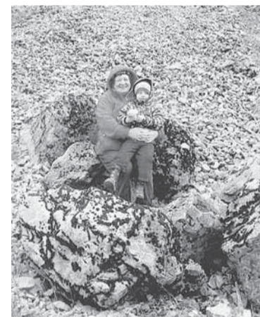
Бабушка и внук путешествуют по Пермскому краю. Взобрались на Полюд полюбоваться красотами Вишеры.