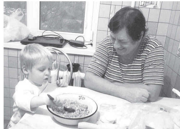
Чебуреки будут — просто пальчики оближешь. Ведь бабушка с внуком готовят их с любовью!