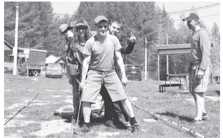
Только на первый взгляд — это просто игра.

В 2015 году после окончания ВУЗов на предприятие трудоустроилось 35 молодых специалистов с высшим профессиональным образованием.