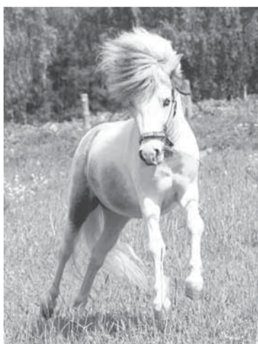
Мишель — прирождённый артист!

Участники конкурса «Журналистская весна» и не думали, что так мало знают о ложках, пока не побывали на экскурсии в Нытвенском музее ложки. Кстати, музей такого профиля — единственный не то что на Урале, но и во всём мире! Здесь вы узнаете, когда появились первые ложки, увидите уникальные экспонаты. А ещё? И сегодня Нытвенский завод выпускает более десяти различных моделей столовых приборов отличного качества. Вы можете купить те, что вам особенно понравятся. Если заинтересовались, то зайдите на сайт музея http://spoonmuseum.com .