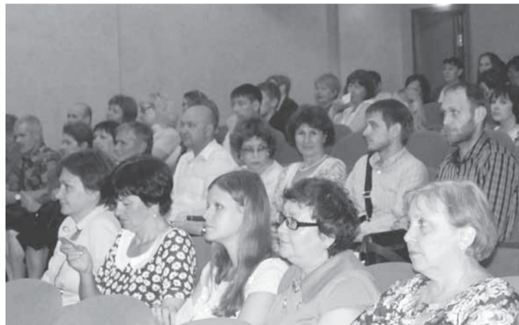
Доклад председателя профкома делегаты слушали очень внимательно.

За прошедший год снизилось количество случаев нарушения трудовой дисциплины. Коэффициент текучести кадров остался на уровне 2014 года.