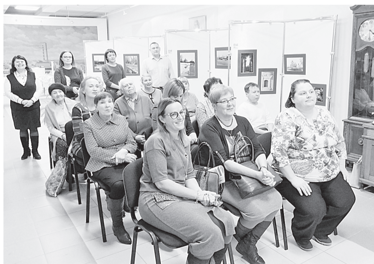
Круг друзей газеты «Бумажник» в гостеприимном музее истории предприятия