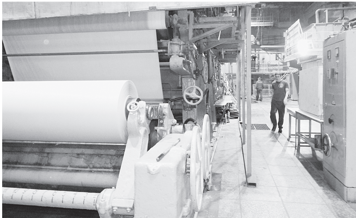
Продукция шестой бумагоделательной машины пользуется устойчивым спросом на рынке

10 декабря этого года подписано Распоряжение об организации складирования отходов бумаги и картона с целью осуществления отдельного накопления отходов бумаги и картона (макулатура) от твёрдых бытовых отходов, возникающих в процессе работы в отделах управления и бухгалтерии, с последующей передачей на переработку макулатуры в бумажное производство № 1.