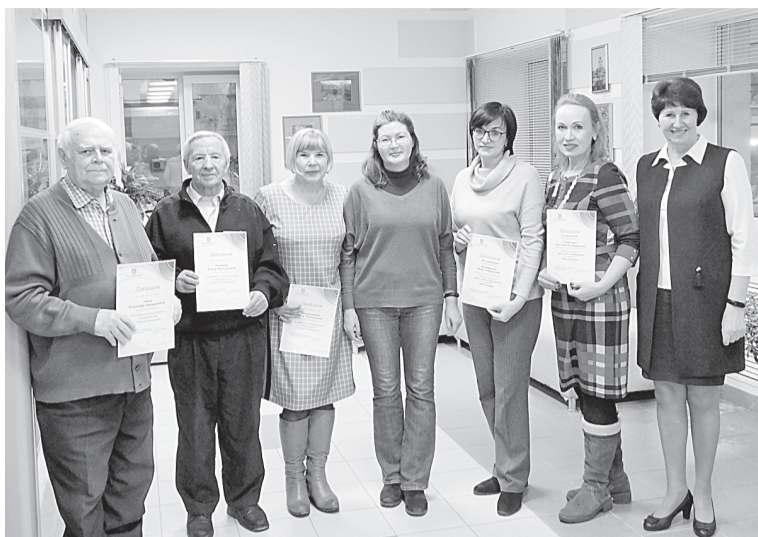
Дипломанты конкурса в номинации «НАШ ЧЕЛОВЕК»

Никогда не отказывают газете в помощи, проявляют инициативу внештатные корреспонденты «Бумажника», о которых хочется сказать: «НАШ ЧЕЛОВЕК!» . Диплом