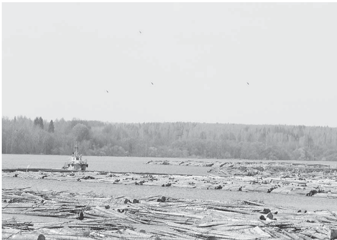
Сплав древесины. Плоты в затоне ОАО «Соликамскбумпром».

КАК И ВСЕГДА, СПЛАВ ДРЕВЕСИНЫ НАЧАЛСЯ БЫСТРЫМИ ТЕМПАМИ. ЗА КОРОТКИЙ ВРЕМЕННОЙ ОТРЕЗОК, ПОКА НЕ УПАЛА ВОДА, ПЛОТЫ ДРЕВЕСИНЫ ДОСТАВЛЕНЫ В ЗАТОН ЛЕСОСЫРЬЕВОГО ПРОИЗВОДСТВА НАШЕГО ПРЕДПРИЯТИЯ.