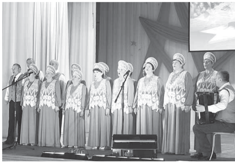
Хор ветеранов «Лейся, песня!» на юбилейном концерте Победы «Этих дней не смолкнет слава!»

Ну и, конечно, всех очень интересует состояние дел на родном предприятии, ведь от его стабильной работы зависит благосостояние многих соликамских семей.