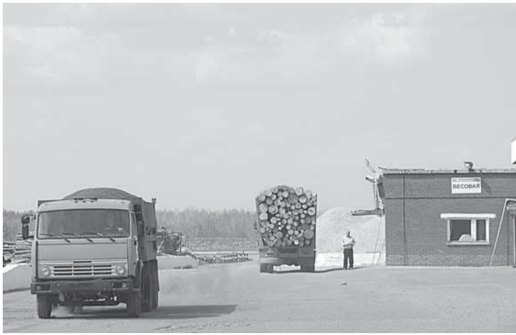
Начинается летний сезон вывозки дровесины АЛЦ.

— Да, у нас был заключен договор с путейцами, которые держали в курсе ситуации, своевременно реагировали на все изменения. ЗАО «Верхнекамская сплавная контора» также дополнительно работала в связи с переводом 15 тысяч кубов на другую точку отстоя — пониже, так как уровень воды в верховьях падал. Все эти применяемые меры позволили вывезти плоты своевременно. Хотя, как я уже сказал, были проблемы с буксировкой. Два плота пришлось спасать. Дровесину разбросало по берегам, потребовалась повторная сплотка. Пучки дровесины буксировщики снова фор-