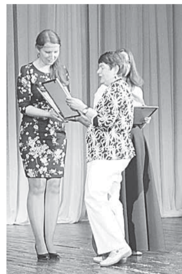
Награждение дипломантов конкурса в номинации «Надежда».

Прислано 375 журналистских работ по 23 номинациям.