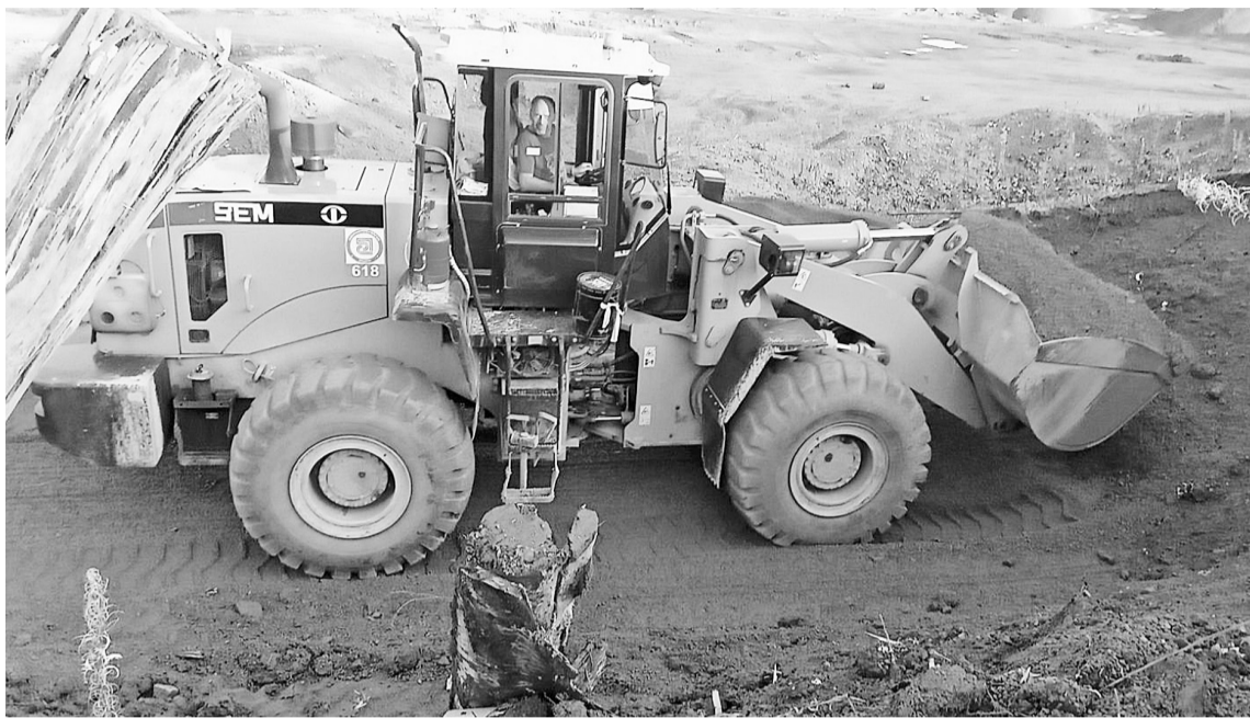
Полным ходом идёт подготовка к сезону зимней вывозки леса

Вся наша жизнь представляет собой непрерывное движение. Утром мы едем на работу, вечером — возвращаемся домой. По выходным отправляемся в гости, на природу. Но это движение было бы невозможным, или весьма затруднительным без людей этой профессии — работников дорожного хозяйства.