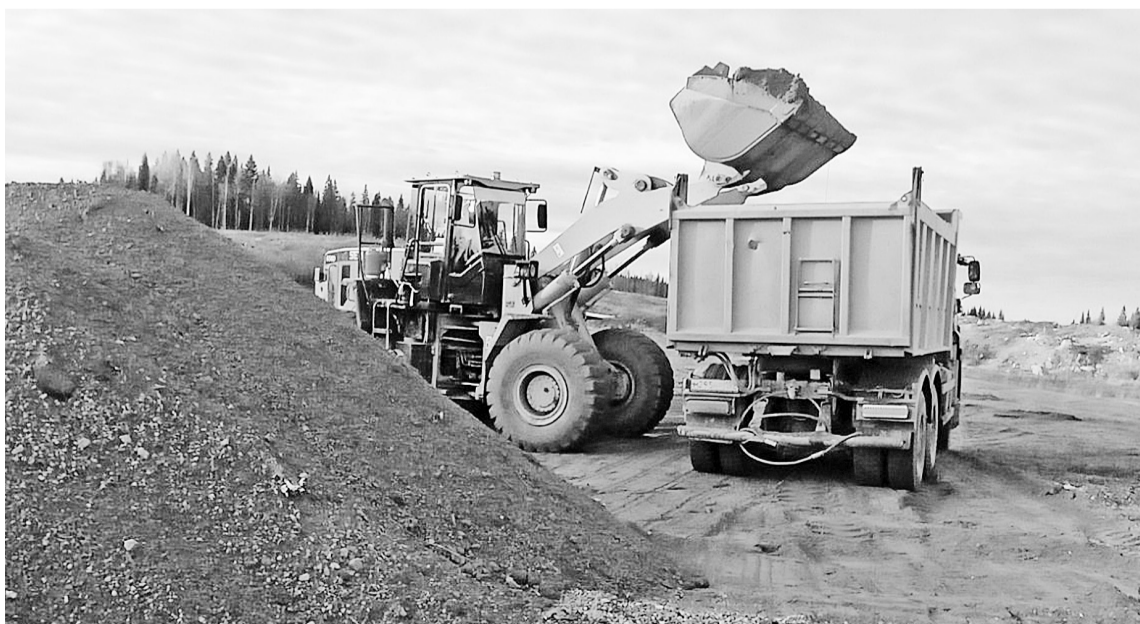
Готовится запас подсыпчного материала