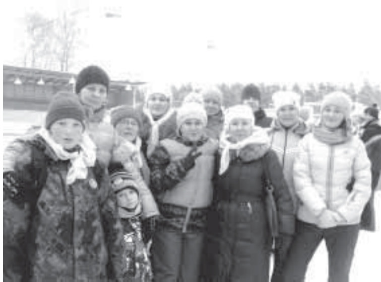
Болельщики ЦОГП — самые дружные и веселые!

Третьего декабря на стадионе «Бумажник» прошли первые в истории спартакиады трудящихся АО «Соликамскбумпром» соревнования по шорт-треку.