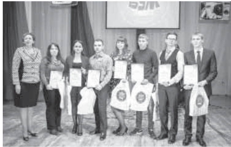
Молодые, активные, креативные, неравнодушные.

Те, кто под шквал аплодисментов поднимаются из зала сейчас, многим хорошо знакомы. Без них не обходится ни одно корпоративное (а порой и городское!) мероприятие.