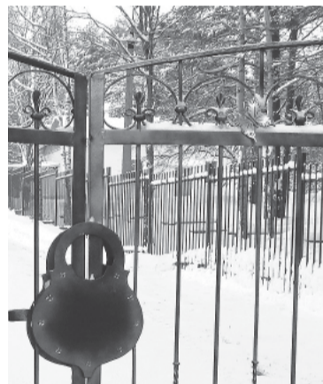
И бабочка — как живая!

— Мы с АО «Соликамскбумпром» сотрудничаем давно, можно сказать, нас связывает давняя дружба. Когда закрылся профилакторий предприятия, комбинат начал направлять детей на летний отдых и оздоровление к нам в «Лесную сказку». Потом