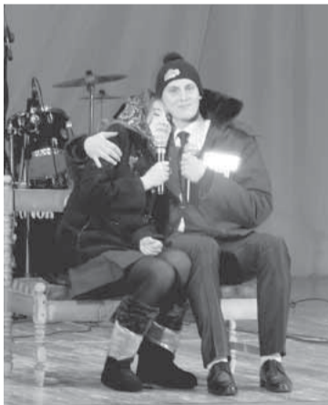
Оживший кадр из фильма «Девчата».

— 2016 год официально объявлен Годом российского кино, вот мы и решили посвятить наше мероприятие этой теме, — делится один из главных «сценаристов» и «режиссёров» всех происходящих в молодёжном объединении «Бумеранг»