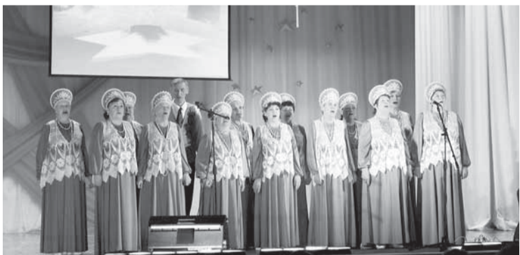
Хор ветеранов-бумажников «Лейся, песня!» — неизменный участник корпоративных праздничных мероприятий.

Но сначала немного истории, которая, думаю, будет интересна многим. 14 сентября 1940 года на техническом совещании при заместителе начальника ГУЛАГа НКВД СССР майора Госбезопасности Орлова заслушивался вопрос по утверждению проекта клуба при Соликамском целлюлозном заводе: «Здание клуба проектируется кирпичное, двухэтажное, частично трёхэтажное. В цокольном этаже — бильярдная, подсобные помещения при сцене и физкультурном зале и котельная. В 1 этаже — вестибюль, фойе, зрительный зал на 500 мест со сценой, кафе с подсобными помещениями,