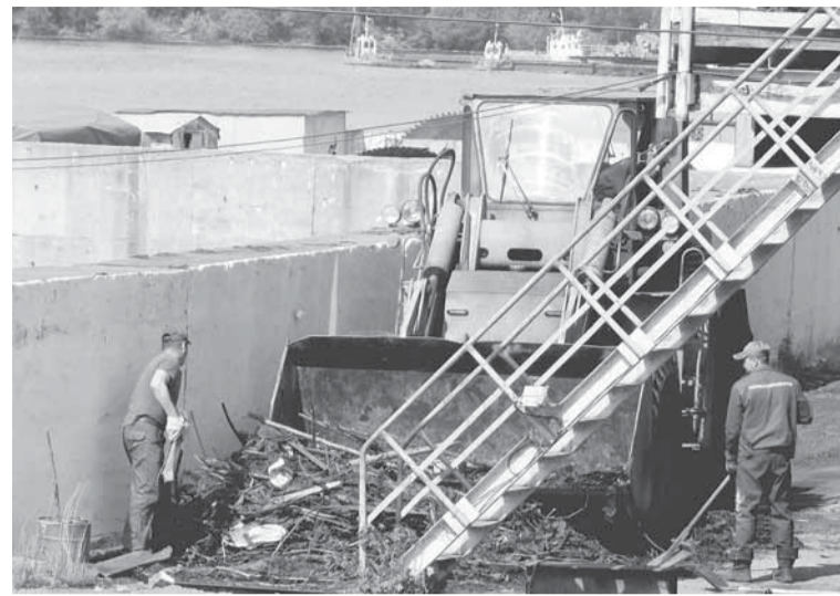
ЛСП наводит чистоту.