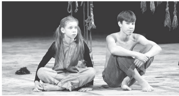
Театр-студия «Перемена». Сцена из спектакля «Уроки выживания».

первый кирпич в фундамент здания. Это стало настоящим событием для жителей Боровска. А 17 мая 1946 года здание клуба было передано Соликамскому целлюлозно-