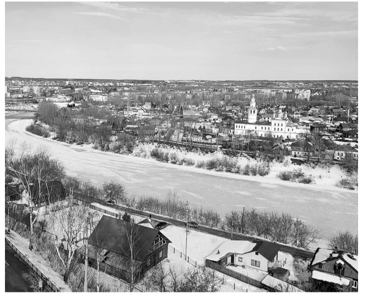
Вид с колокольни

Мы с коллегами любим путешествовать по родному краю, и уже много где побывали. Но на этот раз, когда нам предложили экскурсию в Кунгурскую пещеру, желающих поехать не оказалось. Это меня не остановило. И дальняя дорога — около пяти часов в пути — меня не испугала.