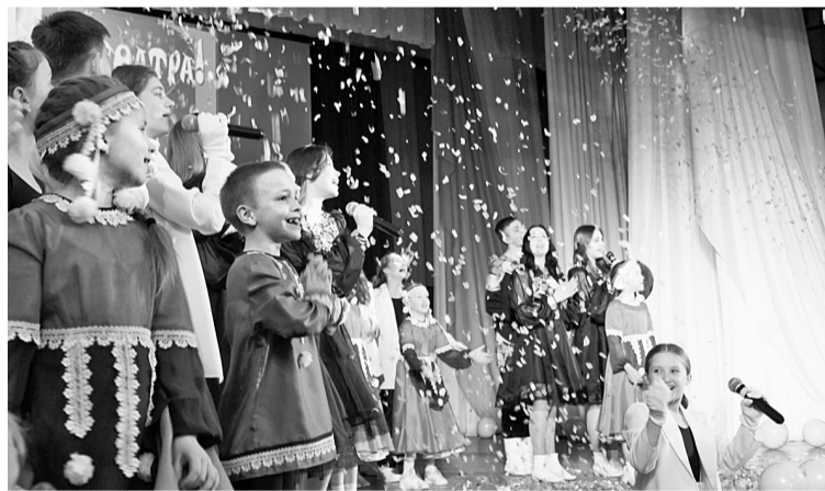
На творческом вечере в ДК «Бумажник»

— Здорово, Кострома! В 4 часа утра театр-студия «Перемена» прибыл в Кострому. Через 4 часа «ПЕРЕМЕНА» открывает VIII Всероссийский конкурс-фестиваль детских театральных коллективов «Фазтон-АРТЕ».