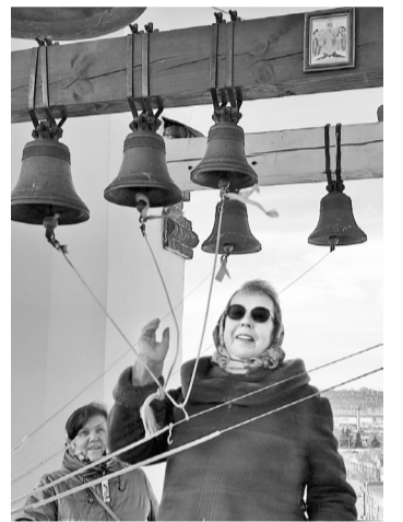
Автор на колокольне Тихвинской церкви

Мы с коллегами любим путешествовать по родному краю, и уже много где побывали. Но на этот раз, когда нам предложили экскурсию в Кунгурскую пещеру, желающих поехать не оказалось. Это меня не остановило. И дальняя дорога — около пяти часов в пути — меня не испугала.