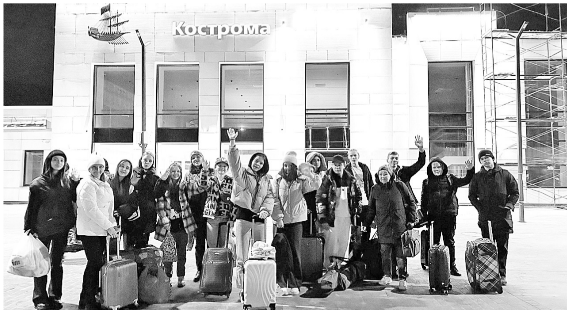
«Перемена» в Костроме