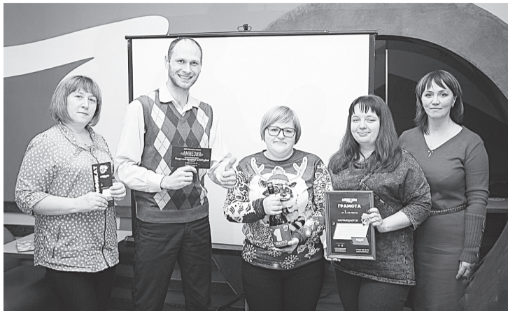
Первое место в игре Эйнштейн Party!

29 ноября 2018 для молодёжного объединения «Бумеранг» останется в памяти как один из самых долгожданных дней.