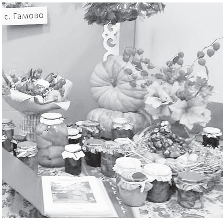
Щедрый стол соседей

Меня привлекли к подготовке для участия в финальном конкурсе, когда весь сценарий выступления был почти готов, оставалось только отрепетировать. Но было видно, какая большая работа была проведена, сколько фантазии и интересных идей воплотилось в сценарии выступления. И вот мы в г. Перми, во дворце Молодёжи. Зал, где проходил конкурс, напоминал весёлый, цветной муравейник. Конкурсанты украшали свои столы и всё пространство вокруг подготовленной заранее атрибутикой, отражающей их садово-огородную деятельность. Многие сразу передевались в концертные костюмы. Приготовив наше место, мы тут же ринулись смотреть и, естественно, фотографировать творчество других конкурсантов. На небольшом пространстве такое буйство фантазии!