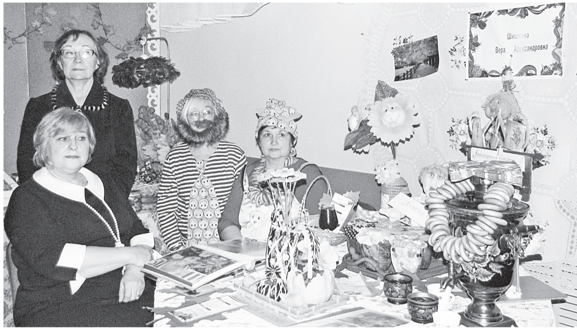
Мы — с Верой, мы — за Веру

У нас на Урале давно лежит снег. Белая земля, белые деревья, и наши садовые участки тоже под снежной пеленой. Но в ноябре мне неожиданно удалось побывать в летне-осеннем разноцветье.