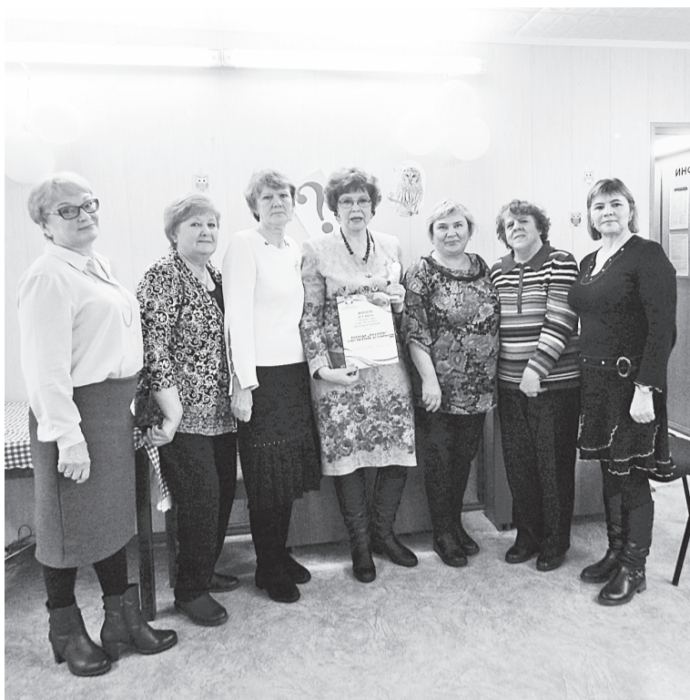
Победители — команда «СуперБУМ»

Организаторы подготовили для конкурсантов три блока вопросов (по семь в каждом). Темой первого блока стали растения и животные, темой второго — Великая