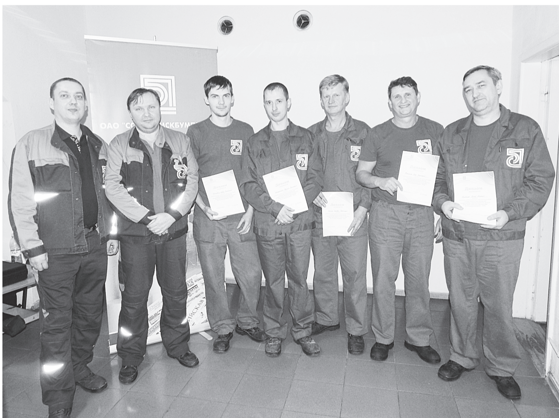
«Лучшая технологическая бригада по производству термомеханической массы из щепы древесно-массного производства АО «Соликамскбумпром» – 2018» (с дипломами) и технологи ДМП (слева)