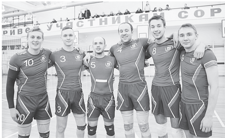
Волейбольная команда «Бумеранг»