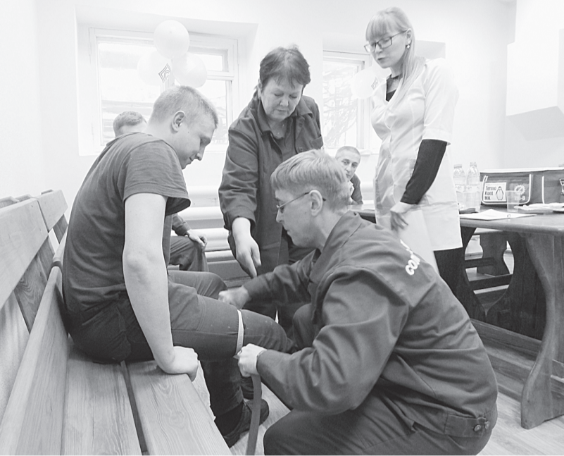
Бригада демонстрирует умение оказывать первую медицинскую помощь

На тестовые задания, которые состояли из 20 вопросов, надо было ответить за 30 минут. Правильный ответ оценивался в один балл. Тестовые задания выполнял каждый участник и сдавал выполненный тест конкурсной