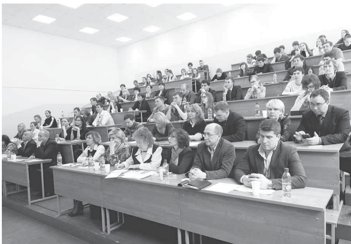
Большой интерес вызвала работа секции «Инновации в создании конкурентных продуктов в ЦБП».

18-19 МАРТА В ПЕРМИ ПРОШЛА IV ВСЕРОССИЙСКАЯ ОТРАСЛЕВАЯ НАУЧНО-ПРАКТИЧЕСКАЯ КОНФЕРЕНЦИЯ. ВНОВЬ ОДНИМ ИЗ ОРГАНИЗАТОРОВ И АКТИВНЫХ УЧАСТНИКОВ СТАЛО ОАО «СОЛИКАМСКБУМПРОМ».