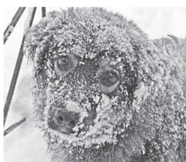
Вы спасёте меня?

Я тоже жалела голодных собак, которых видела