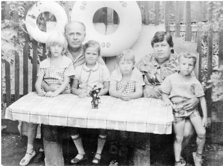
В гостях у бабушки и дедушки

Жаль, что внуки бывали у неё только летом.