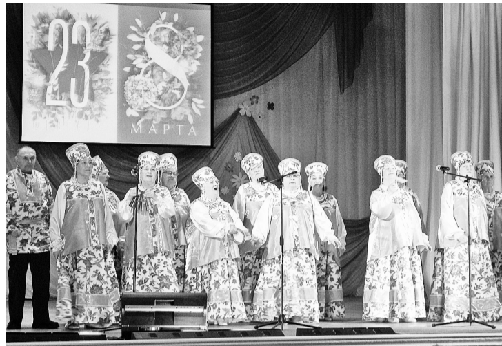
Наш хор ветеранов расцвёл в новых костюмах, как весенний сад

Что может быть лучше праздника? Конечно, два праздника. Поэтому ДК «Бумажник» пригласил всех 2 марта на концертную программу «Февромарт».