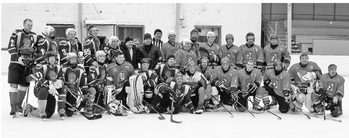
На соликамском льду команды ГП «ПЦБК» (слева) и АО «Соликамскбумпром» (справа)

В субботу 3 марта уже соликамские бумажники принимали пермских на своём стадионе. В три часа начался хоккейный матч. Нельзя сказать, что трибуны были переполнены болельщиками. Но группы поддержки обеих команд болели неистово.