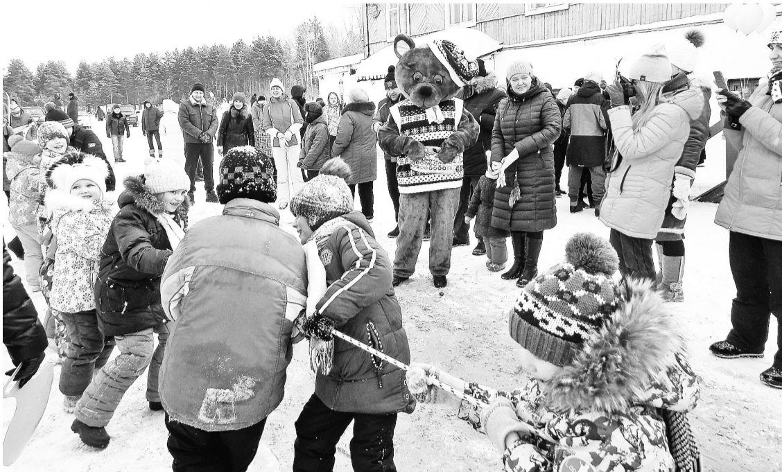
У детей воля к победе не менее сильна, чем у взрослых