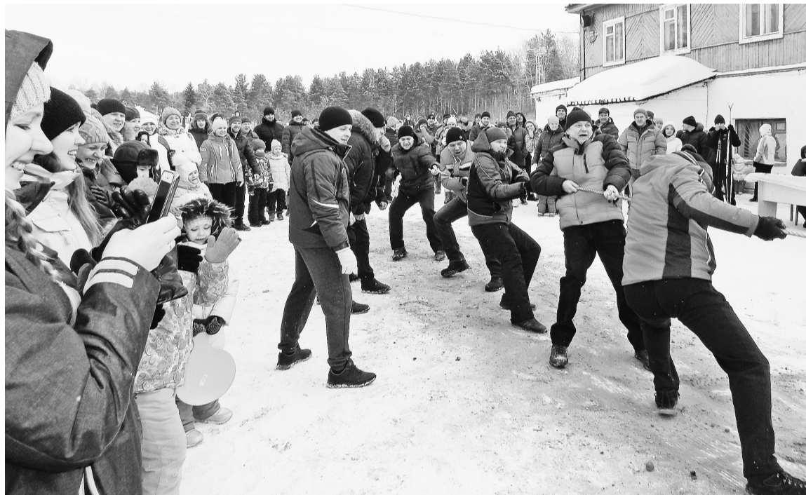
Команды из всех сил стремятся к победе. Болельщики едва сдерживаются, чтобы не ухватиться за канат

В четвёртый раз собирают бумажников на излёте зимы соревнования «Зимние забавы». Приходят с семьями и друзьями. Заядлые спортсмены готовы состязаться в силе, ловкости, скорости. А многочисленные группы поддержки готовы «болеть» во всё горло.