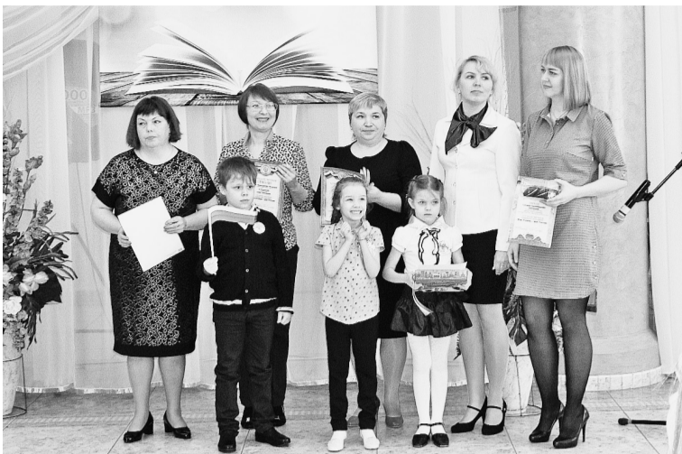
Участники конференции с родителями и педагогами