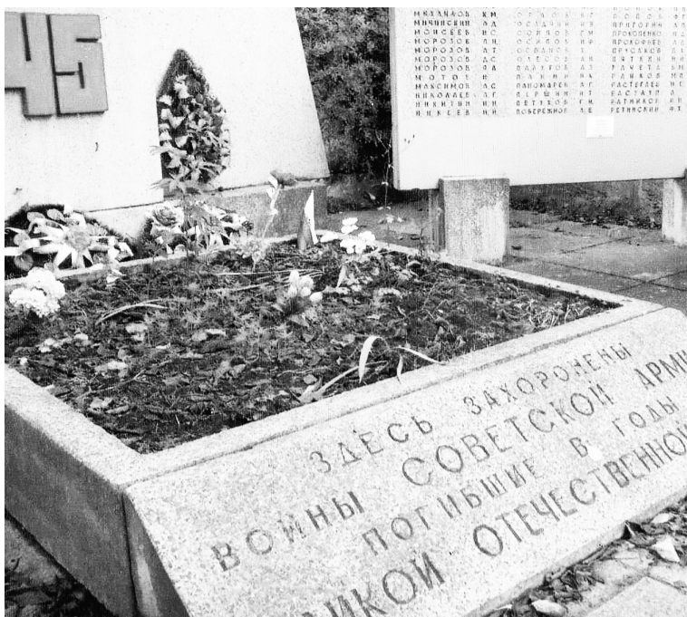
Мемориал и табличка с именем героя