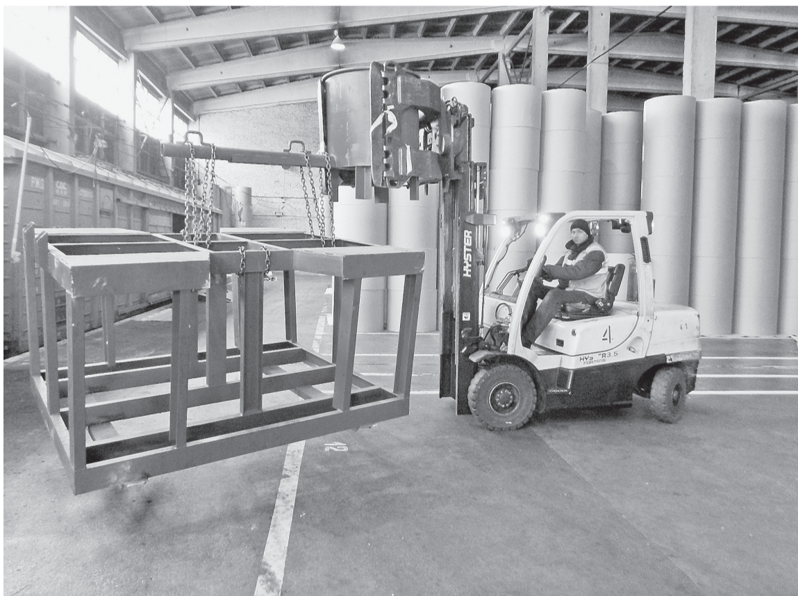
Новая опора устанавливается на железнодорожных путях и обеспечивает доступ погрузчика к контейнеру

— Распоряжение предусматривает обязательную полную загрузку всех железнодорожных платформ, — поясняет начальник