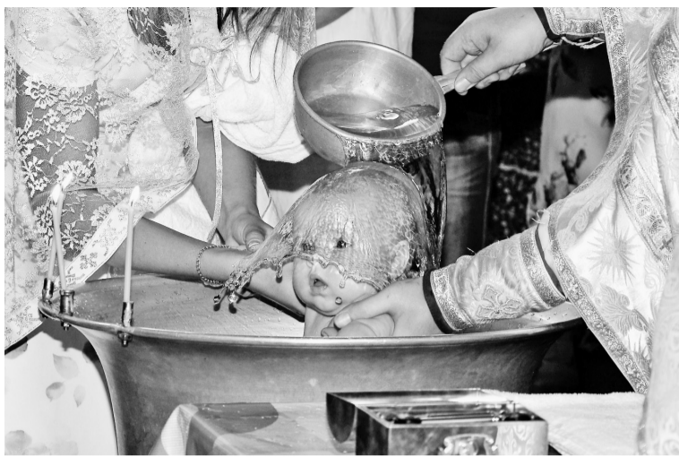
Счастливы кадр

И с этим трудно не согласиться, действительно, фотография ещё даже тридцать лет назад — процесс почти магический.