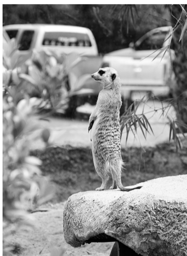
Городские джунгли

Прежде чем стать памятными фото, отснятая плёнка проходила нелёгкий и интересный путь. Наверное, нет такого человека, который бы ни разу не видел тёмную комнату с развешенными для просушки снимками. Сохранилось ли волшебство с переходом на цифровое фото?