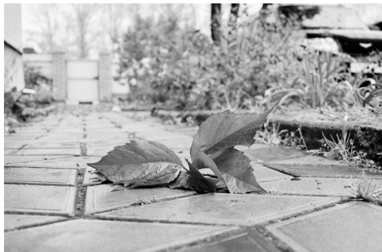
Красота момента