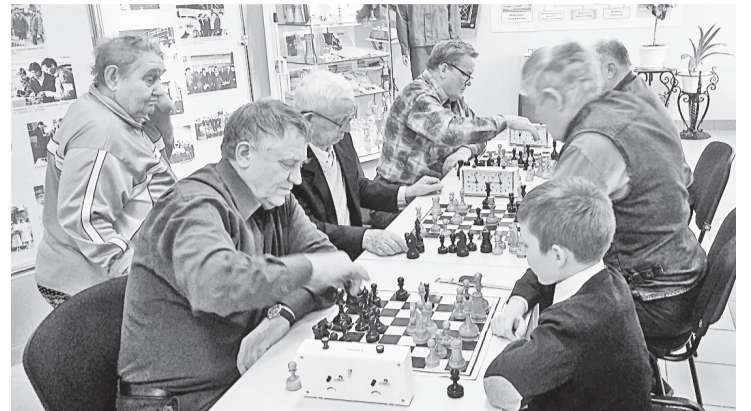
Шахматный турнир в канун Дня защитника Отечества

18 февраля в шахматном клубе при музее АО «Соликамскбумпром» закончился шахматный турнир, посвящённый Дню защитника Отечества.