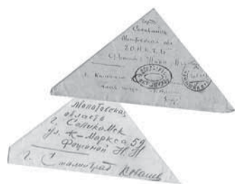
Письма военных лет (1944 год).

Во время Великой Отечественной войны ежемесячно только в действующую Красную армию доставлялось 70 миллионов писем.