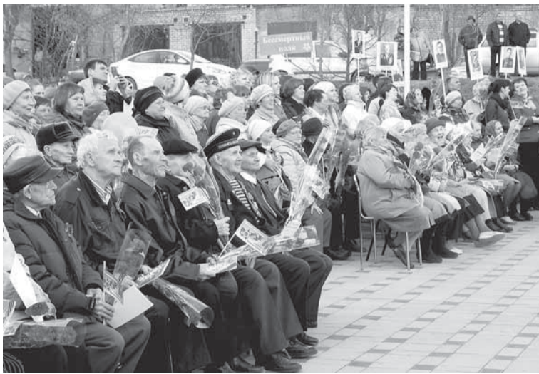
Митинг у памятника павшим воинам-бумажникам. 8 мая 2015 год. Ветераны смотрят на праздничный салют.