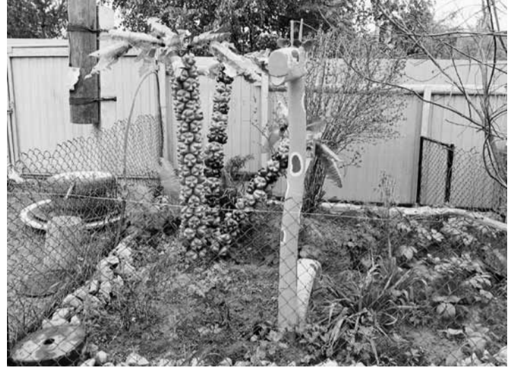
Здесь гуляет жираф

Помните строчки из детской песенки: «Есть на свете место беззаботное, где гуляет важно, словно граф, очень длинношее животное под чудным названием «Жираф»?»