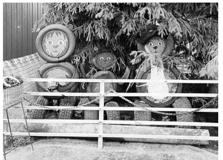
Три медведя ждут свою Машу