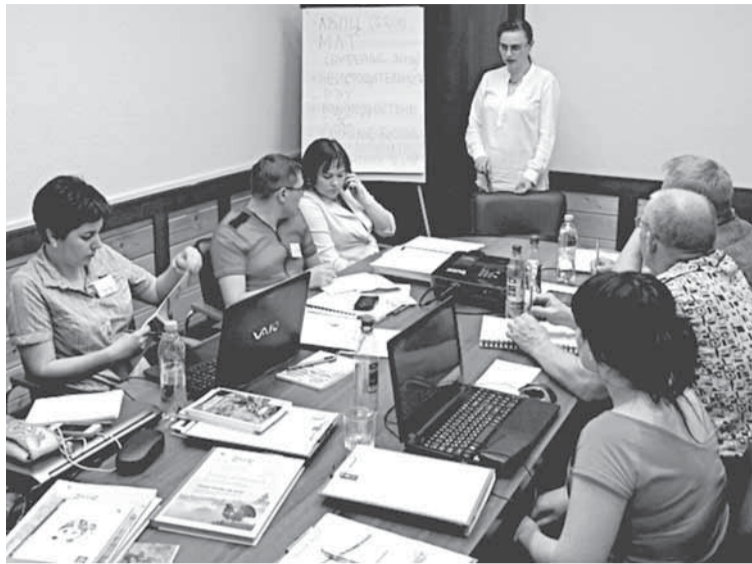
Обсуждение проблемных аспектов стандарта по лесопроизводству.

— Семинар проходил с 1 по 4 июня на базе этнопарка «Финноугория», у села Ыб. В первый день специалисты FSC познакомили нас с происходящими событиями и новшествами в системе, в том числе с возможностями применения информационных технологий и онлайн-платформ в FSC. Во второй день мы обсуждали проблемные аспекты сертификации, которые были заранее определены самими участниками посред-