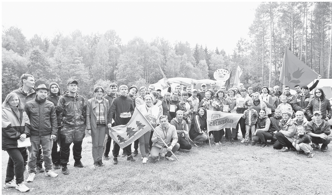
Наш десятый юбилейный турслёт

Команды приступили к обустройству. Некоторые параллельно успевали порепетировать «Представление команды».