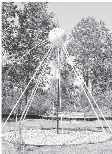
Новый арт-объект ботанического сада

АО «Соликамскбумпром» выступило партнёром ежегодного летнего мероприятия г. Соликамска — Demidov Flora Festival, организованного Мемориальным ботаническим садом Г.А. Демидова.