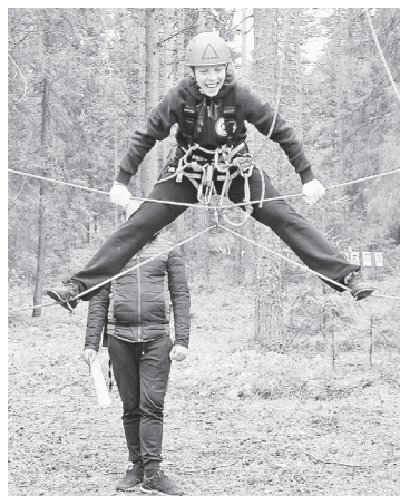
Вот такая «бабочка»

Команда «Туристы из сказки» зажгла в танце с «избушкой на курьих ножках». Команда «Прометей» ремонтно-механического цеха тоже представилась в стихах.