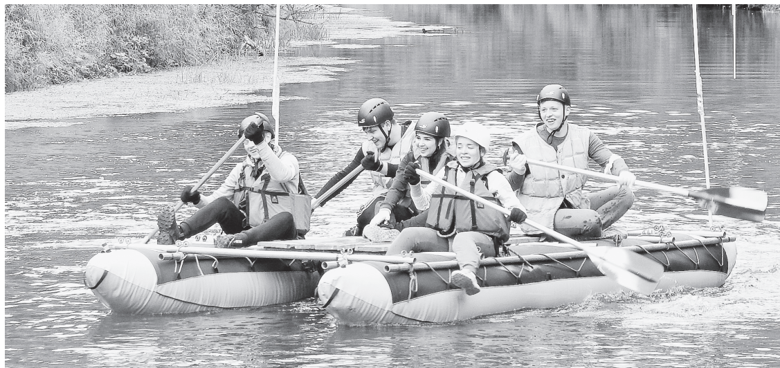
«Дети леса» в азарте.