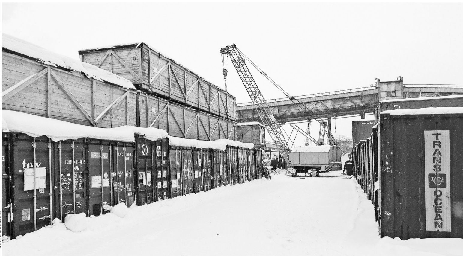
В контейнерном городе можно даже посчитать этажи

С началом реконструкции теплоэлектроцентрали вокруг неё вырос целый контейнерный город. Здесь хранится всё необходимое для строительно-монтажных работ от маленькой гаечки до крупных узлов оборудования.