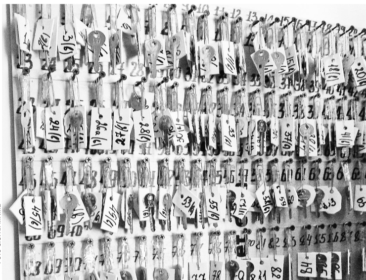
Это всё ключи от контейнеров. Поэтому кладовщиков часто называют в шутку ключницами

— Оформление документов на каждую единицу хранения для передачи на другой склад. Но в первую очередь производится таможенное оформление для выпуска товаров в свободное пользование, согласно законодательству РФ. Этим занимается специализированная фирма в Перми, с которой заключён договор. Процесс таможенного оформления для выпуска товаров в свободное пользование в соответствии с законодательством РФ — сложный и длительный. И у нас очень