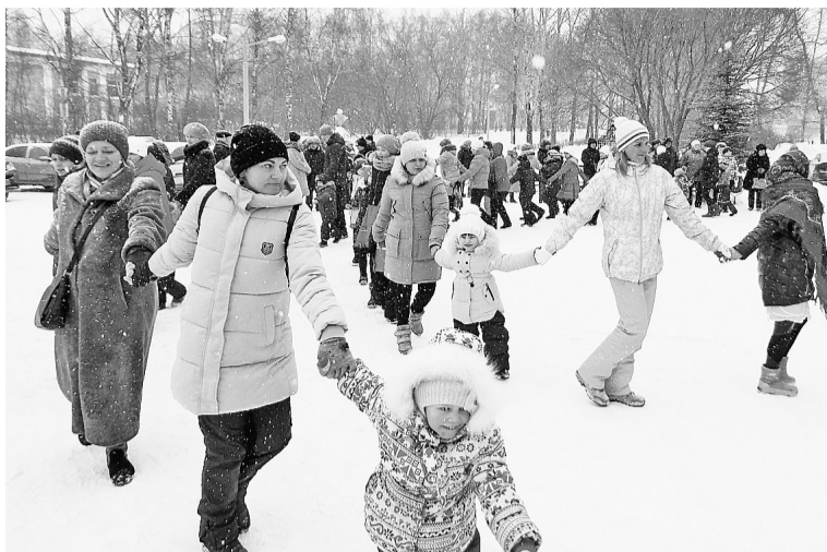
Танцуем, хороводим — Зимушку проводим!

Всё, зимний сезон можно считать официально закрытым. Как же так, скажете вы, по календарю-то ещё несколько деньков осталось. А вот те, кто был на масленичных гуляниях в ДК «Бумажник» 17 февраля, подтвердят – Зимушку-зиму проводили настолько весело, задорно и вкусно, что она наверняка уступит своё место Весне досрочно.