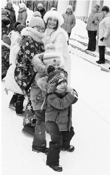
Пытается и стар, и млад тугой перетянуть канат

— В какую команду пойдём — Зимы или Весны? —