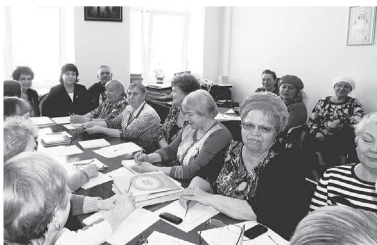
Заседание Совета участковых по выборам председателя Совета ветеранов.

Даже с самой любимой работой когда-нибудь приходится расставаться, наступает время для отдыха.