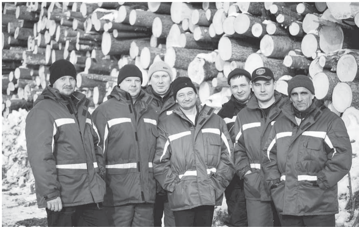
Первая бригада ООО «Красновишерск Лес».

ЗНАЧЕНИЕ НОВОЙ ТЕХНИКИ ДЛЯ РАЗВИТИЯ ПРОИЗВОДСТВА ТРУДНО ПЕРЕОЦЕНИТЬ. УВЕЛИЧИВАЕТСЯ МОЩНОСТЬ — РАСТУТ ОБЪЁМЫ. ОСВАИВАЯ НОВЫЕ ТЕХНОЛОГИИ, РАБОТНИКИ ПРЕДПРИЯТИЙ РАСТУТ ПРОФЕССИОНАЛЬНО. И УСЛОВИЯ ИХ ТРУДА СТАНОВЯТСЯ ЛУЧШЕ. НО ЕСЛИ ГОВОРИТЬ ОБ УЛУЧШЕНИИ ЖИЗНИ ЦЕЛОЙ ТЕРРИТОРИИ, ТО НЕОБХОДИМО РАЗВИВАТЬ НЕ ТОЛЬКО ПРОИЗВОДСТВО.